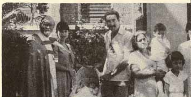
Bautismo durante Visita Pastoral a la Iglesia San Anuro, Mayagüez