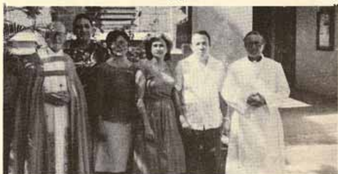
Vista Pastoral a la Iglesia San Andrés, Mayagüez