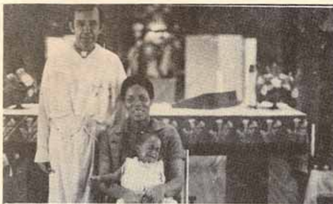
La primera persona bautizada en la Iglesia Santo Tomás, Bo. Martín González de Carolina, trajo también su hija a ser bautizada allí.