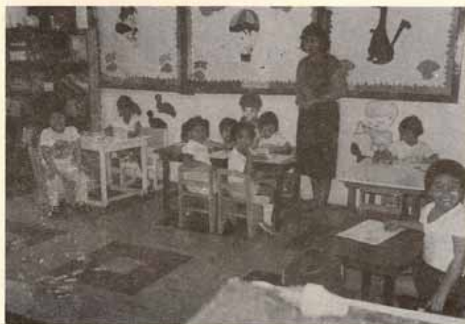
Centro de Cuidado Diurno, Iglesia Santa María-Virgen Ponce, P.R.