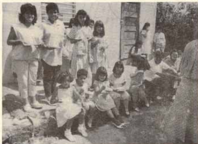
Visita Pastoral, Iglesia La Transfiguración, Bo. Rubias, Yauco, P.R.