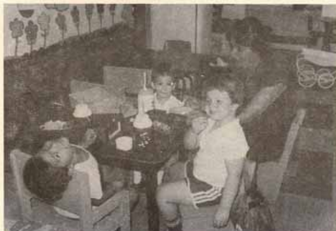
Centro de Cuidado Diurno Iglesia Santa María Virgen, Ponce, P.R.