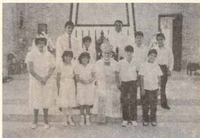
Visita Pastoral Iglesia La Reconciliación, Quebrada Limón, Ponce, P.R.