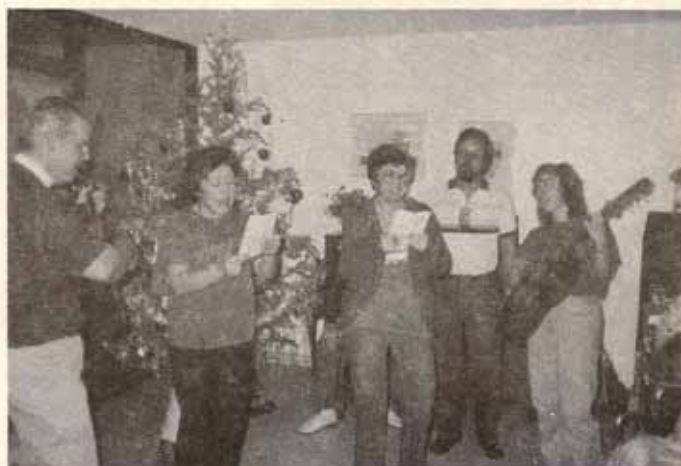
Cantores en Misa de aguinaldos en la Iglesia La Encarnación Rousvelt, Hato Rey, P.R.