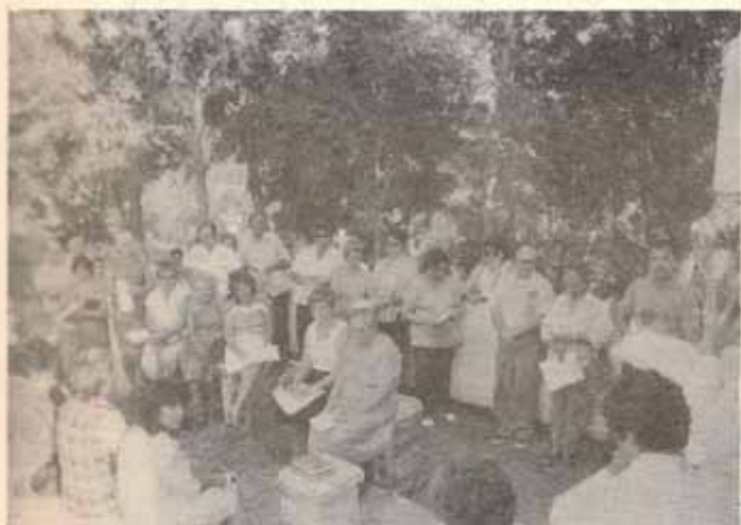
Feligreses en el Cementerio Getsemaní, Quebrada Limón, Ponce, P.R.