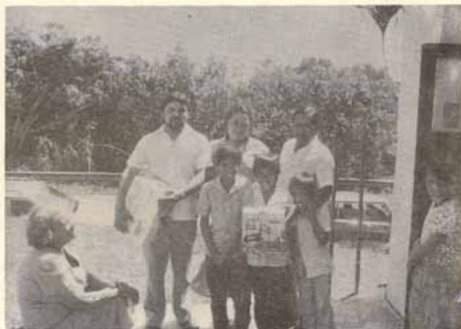
Visita Pastoral, Iglesia La Transfiguración, Bo. Rubias, Yauco, P.R.