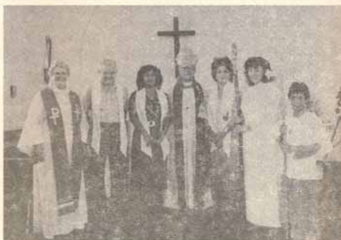
Visita Pastoral Iglesia San Lucas, Ponce, P.R.