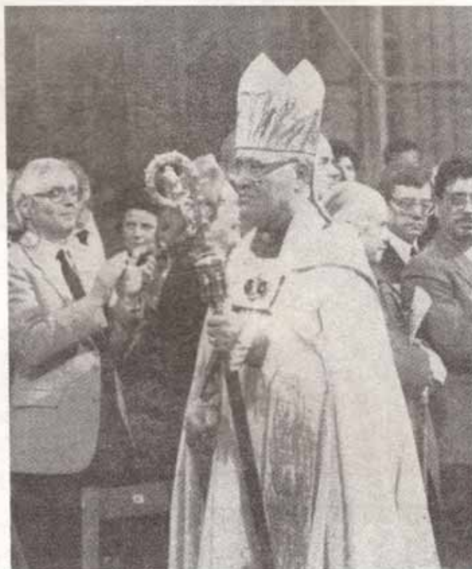
Su Eminencia Reverendísima Dr. George Carey Arzobispo de Canterbury

Su familia de origen viene de los sectores pobres de Londres, siendo hijo de un portero de un hospital. Dejó la escuela a los 15 años para trabajar y luego sirvió en la Real Fuerza Aérea. Posee un doctorado en Patrística y es fanático del balompié. La esposa