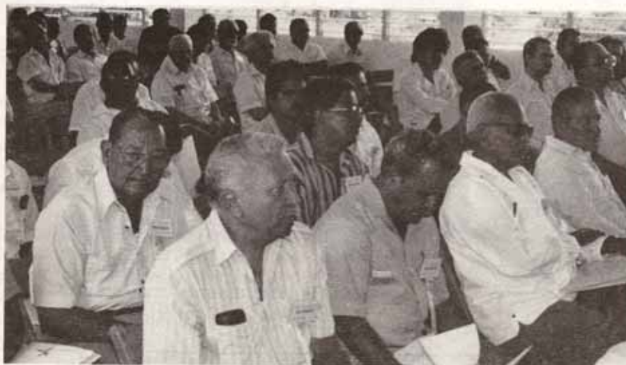
Participantes a la Asamblea de Hombres Episcopales