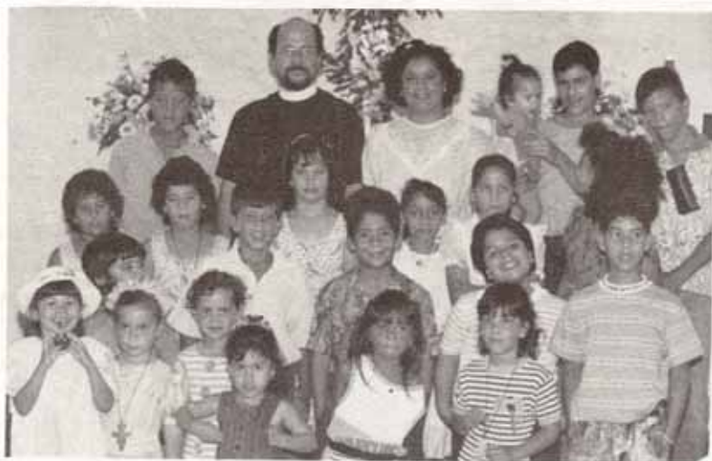
Grupo de Escuela Bíblica de la Iglesia San Mateo, Peñuelas