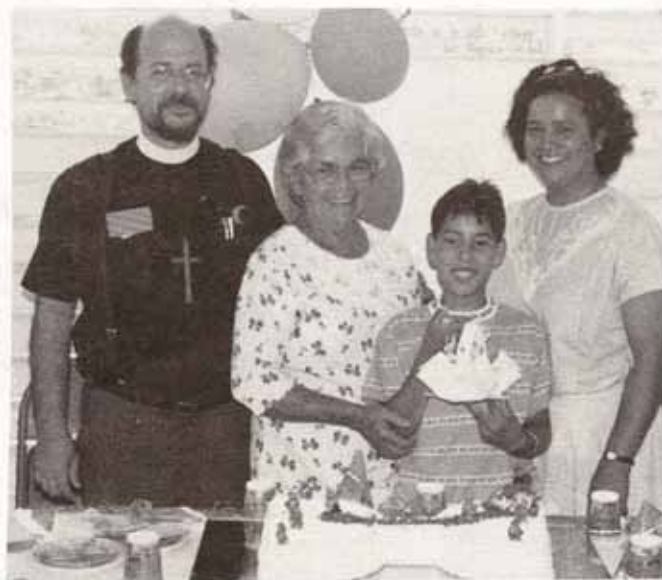
Celebración Día del Envejeciente Iglesia San Mateo, Peñuelas