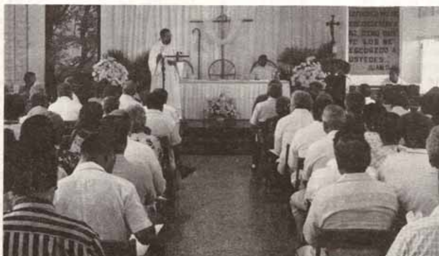
Acto liturgico de apertura a la Asamblea de Hombres Episcopales