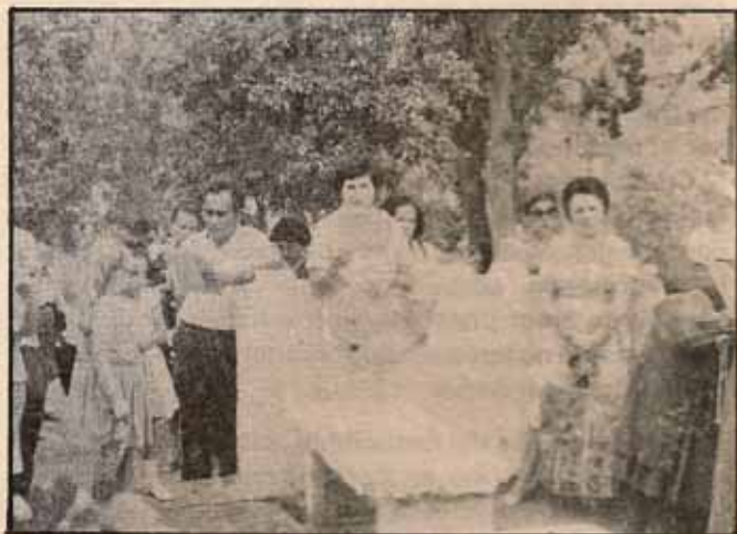
Concurrencia a Misa de Difuntos, Cementerio Jardín de Getsemani, Ponce