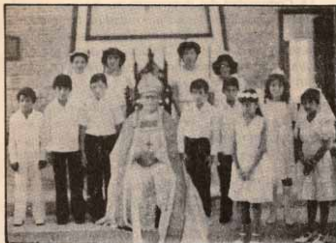
Visita Pastoral, Iglesia La Reconciliación, Bo. Quebrada Limón, Ponce