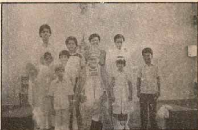
Visita Pastoral, Iglesia La Encarnación, Roosevelt, Hato Rey