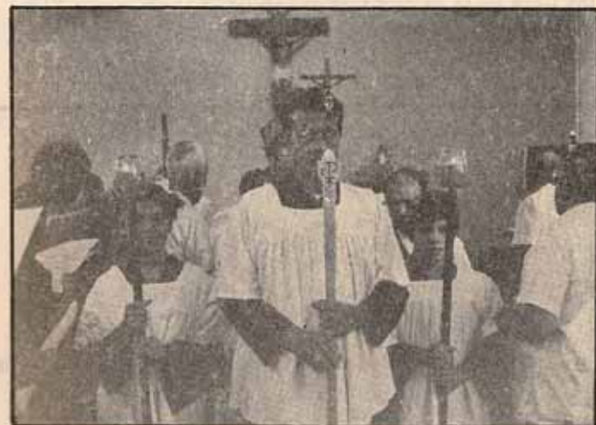
Iglesia S. Mateo, Bo. Quebrada Ceiba, Peñuelas