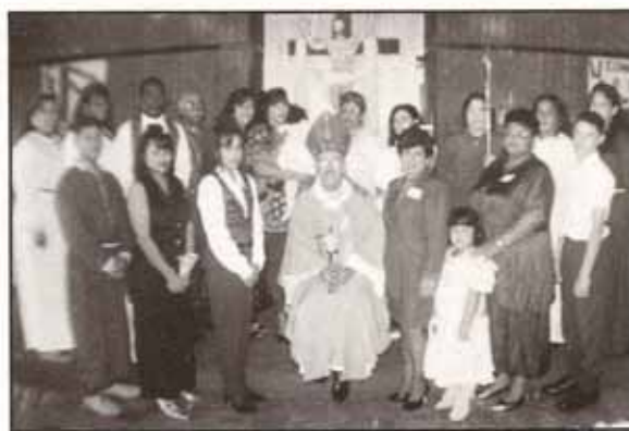
Visita Pastoral: Iglesia El Buen Pastor, Fajardo

P.O. Box 902 St. Just, Puerto Rico 00978 Tel.: (809) 761-9800 Fax.: (809) 761-0320