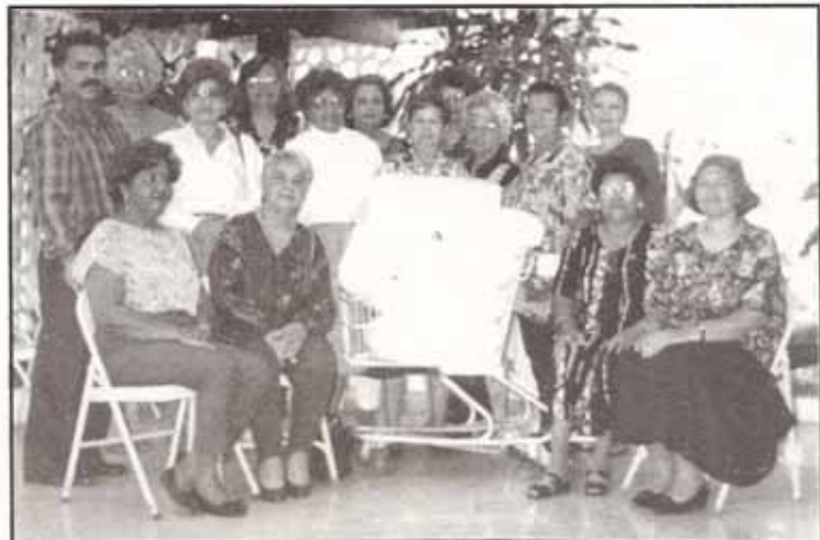
Representación de las Mujeres Episcopales en acto de entrega de donativo de sábanas al Hospital Oncológico en Ponce

La Convención del año 1996 será bajo los auspicios de la Iglesia Santa Ana, una nueva misión de nuestra Diócesis en Sabana Grande.