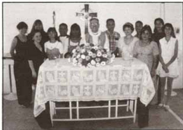
Instalación de la nueva directiva de la Asociación de Juventud Episcopal celebrada en la Iglesia Apóstol Santiago en Río Grande

Amor es algo que nadie puede quitar a otro, pero que podemos dar constantemente y enriquecemos cada vez más. El amor no puede darse por ofendido ya que no puede saber algo que por sí mismo no puede concebir. Tampoco puede hacer daño, ni ser dañado porque constituye el más puro reflejo de Dios que es la bondad. Es la fuerza indestructible de lo bueno; es la voluntad de Dios que concibe, prepara y ejecuta siempre lo más conveniente para toda su creación.