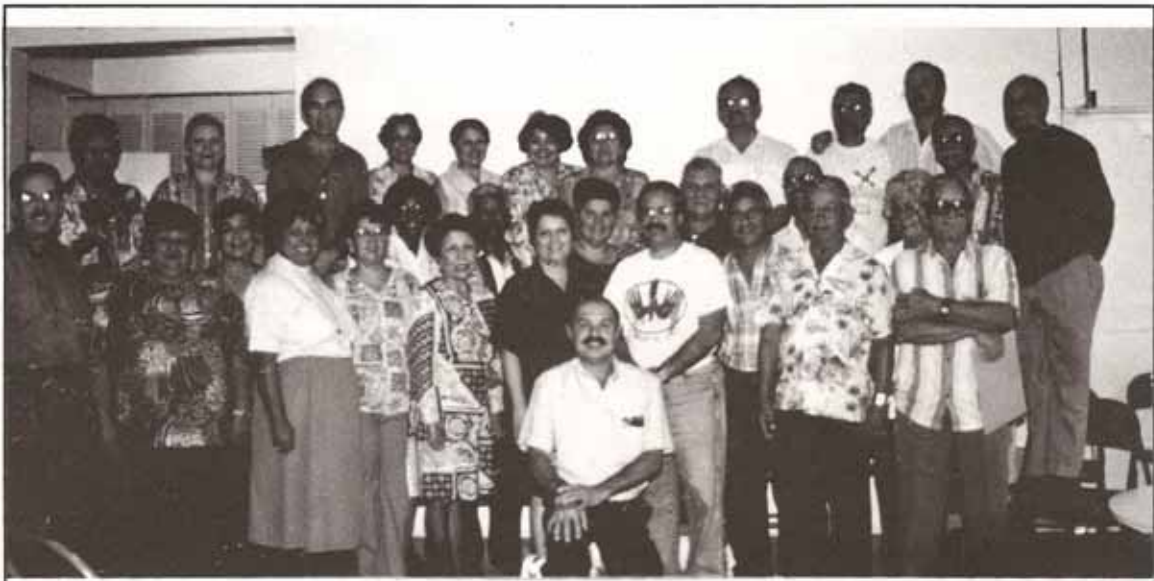
Participantes de la Escuela de Diurigentes del Secretariado de Cursillos de nuestra Diócesis.

En resumen, nuestra Iglesia enseña que la responsabilidad de decidir cuántos hijos tener y con qué frecuencia hayan de procrearlos es una prerrogativa ejercida por acuerdo mutuo entre los cónyuges.