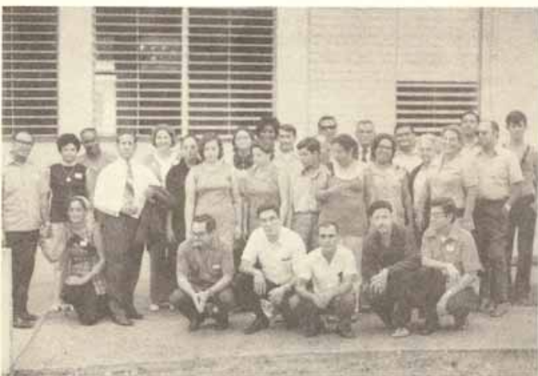
Grupo asistente a la Conferencia del Señor Obispo para laicos, celebrada en el Centro Diocesano San Justo.