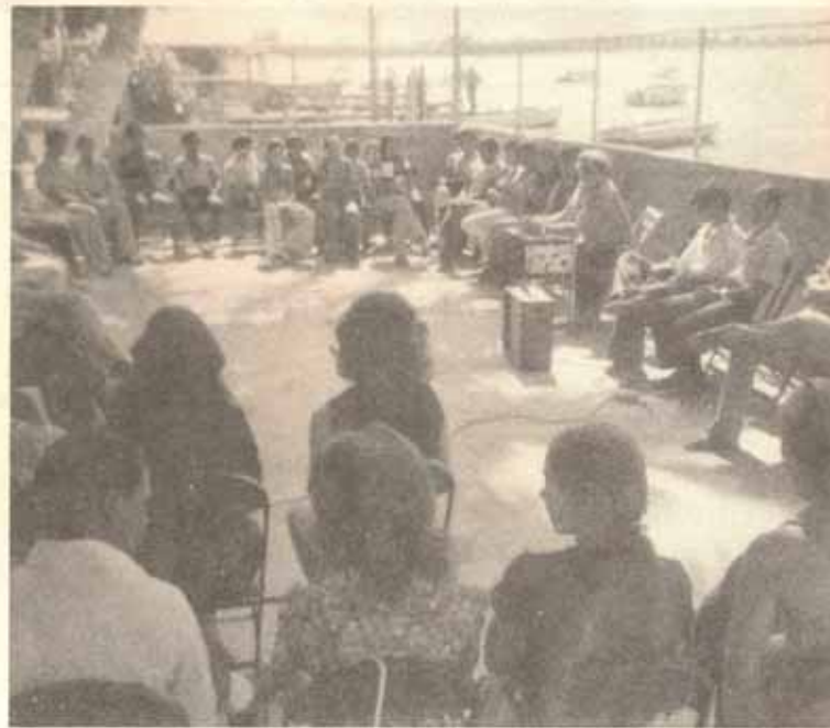
Conferencia, diálogo; enseñanzas fuertes que hacen pensar y abrir nuevos horizontes al diario ir y venir.