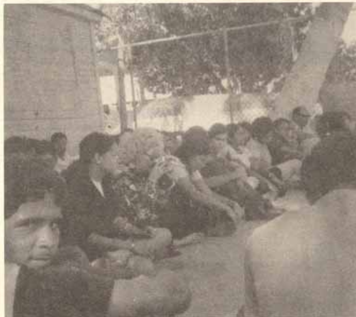
"Esta es mi sangre...Momento de la Santa Comunión, colofón del retiro.