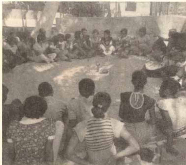
El pan y vino están preparados...Celebración de la partición del pan y comunión del vino eucarísticos.