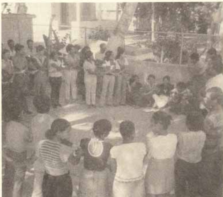
"No importa a la iglesia que vayas..." Hermandad, confraternidad de espíritus jóvenes y manos que se unen en paz y caridad.

El 18 de abril de 8 am hasta 4:30 pm un nutrido grupo de jóvenes del área sur se dieron cita en El Tuque, a orillas del mar, para reflexionar y pensar en el actual mundo a la luz de las enseñanzas bíblicas. Tal actividad fue organizada y patronizada por el Conjunto LOS EX conjuntamente con los PP. Santos, Jiménez y Ausás. El despliegue fotográfico será más elocuente que las palabras.