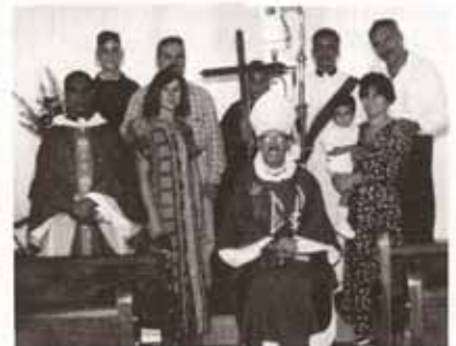
Bautismos en Visita Pastoral a la Iglesia San Bartolomé Apóstol, Bo. Bartolo, Lares.