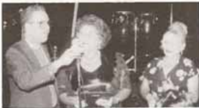
Reconocimiento a la Iglesia Santa Ana, Sabana Grande, durante la 88 va Asamblea Diocesana.

La mayordomía buena, la cristiana, nos enseña que el cristianismo debe administrar los dones que recibe de Dios con el fin de producir ganancias. Esto implica que cada uno de nosotros está llamado a dedicar todo lo que tiene y es al dueño, que es Dios. Trabajamos para Dios. Por lo tanto, el dar cristiano es sacramental, pues el que da se ofrece a sí mismo. Simbolizamos esta ofrenda y dedicación de nosotros mismos con la ofrenda visible de nuestro tiempo, talento y dinero que damos a la Iglesia. Es por eso que nuestro ofrendar y nuestra administración de los bienes que Dios nos da debe ser algo dinámico, y no estático. Estamos llamados, no a invertir nuestro tiempo, nuestro talento, y nuestro dinero en la manera acostumbrada, sino a invertirlo para la obra de Dios, para la extensión de su reino en todas partes del mundo. Esta es nuestra verdadera mayordomía: el permitir que nuestra visión se ensanche, para así dedicarnos a trabajar para Dios; para así dar lo que tenemos para la misión de la Iglesia; para así trabajar para el dueño, el Señor nuestro Dios, en todo el mundo.