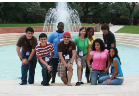
Participantes de la Diócesis de Puerto Rico en el E.Y.E. 2008