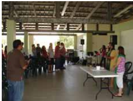
Santa Eucaristía de apertura en la actividad de universitarios en Playa Buyé

Agradecemos a todas las personas que siempre nos apoyan y les pedimos continúen orando para que fortalezcamos el ministerio de los jóvenes dentro de nuestra Iglesia Episcopal Puertorriqueña. Estén pendientes a nuestras próximas actividades.