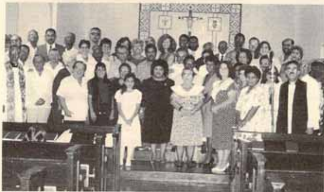
Personas licenciadas para Ministerios laicos en las áreas Norte, Este, Noreste y Centro este de la Diócesis.