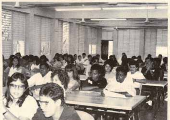
Vista parcial de la juventud presente en la Convención de la Juventud Episcopal.