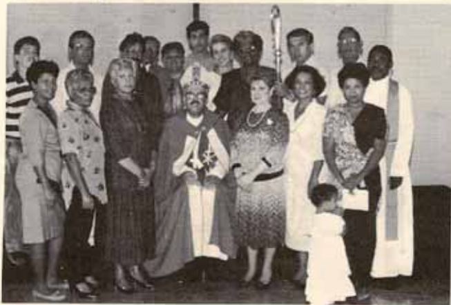
Instalación de Junta y liderato laico de la Iglesia El Buen Pastor, Fajardo, P.R.