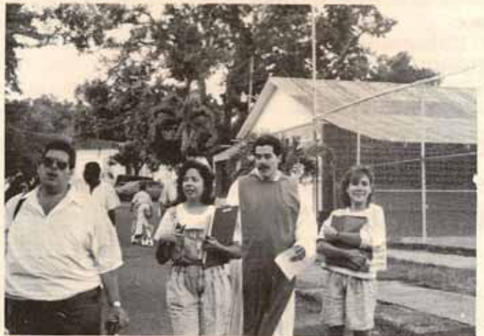
Líderes de la Juventud Episcopal.