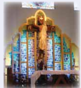
Altar de la Nueva Misión San Lucas Evangelista, donde se celebró la Asamblea Diocesana.