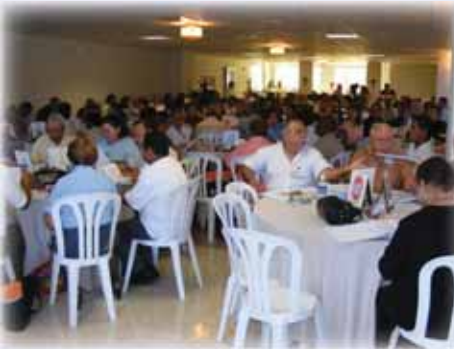
Vista parcial de los delegados a la Asamblea