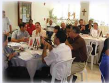
Vista parcial de los delegados a la Asamblea