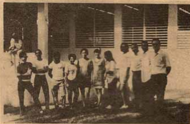
Jóvenes voluntarios que sirvieron este año como consejeros en la Conferencia de Verano realizando una magnífica labor.

La segunda sesión, para las edades de 15 a 20 años se llevó a cabo del 22 al 28 de junio. El Tema de las Conferencias en esta sesión, era escogido por los propios jóvenes. Entre ellos, la adición a drogas, en esta oportunidad un exadicto del hogar CREA, del Bo. St. Just, Trujillo Alto, ofreció una charla. Otros temas fueron: Las relaciones entre