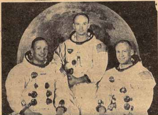
De izquierda a derecha: Neil Armstrong, Michael Collins y Edwin E. Aldrin, tripulantes de la nave Apolo XI, quienes realizaron la hazaña más fabulosa que haya podido llevar a cabo el hombre en los últimos tiempos.