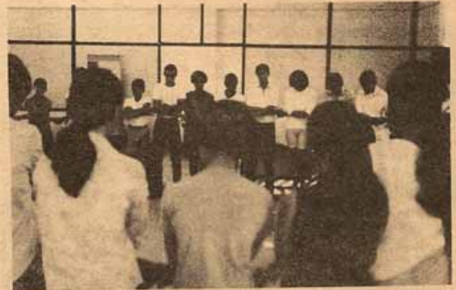
En la parte devocional, se alternaba una mañana con la Santa Comunión y otra de meditaciones acerca de la oración, la cual terminaba en una cadena de oración, donde los jóvenes tenían oraciones espontáneas.