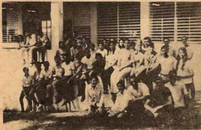
Jóvenes participantes en la segunda sesión de la Conferencia de Verano, para las edades de 15 a 20 años.