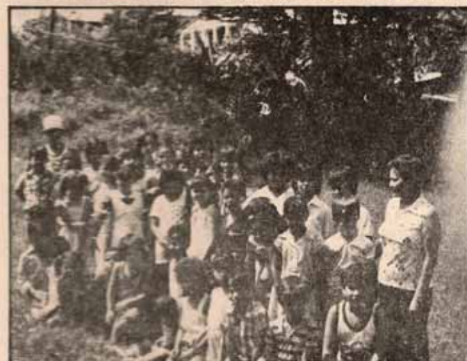
Grupo de niños participantes de la escuela de vacaciones de la Iglesia Santa Hilda, Bo. Las Cuevas, Trujillo Alto, P.R.