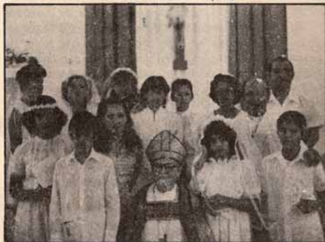
Visita Pastoral Iglesia San Marcos, Bo. Magueyes, Ponce, P.R.