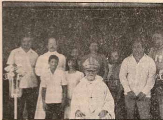
Visita Pastoral Iglesia Santa Cecilia, Ensenada, P.R.