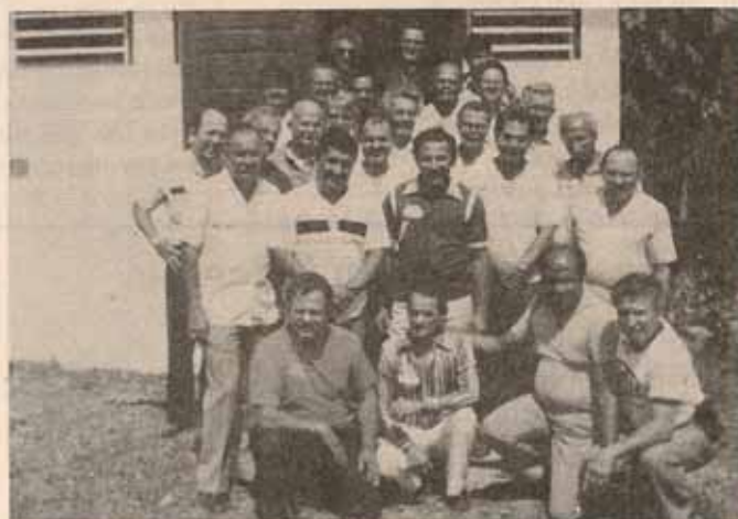
Hombres Episcopales en el Primer Cursillo Renovación Cristiana Episcopal, celebrado en Manatí.