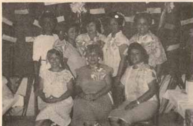
Mujeres Episcopales en el Primer Cursillo Renovación Cristiana Episcopal.