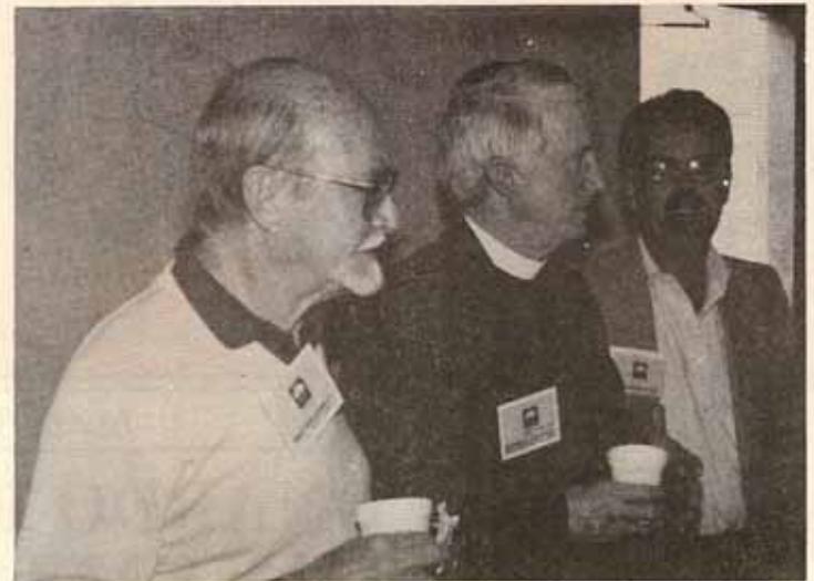
El Padre David Alvarez y el Obispo Reus durante una conversación con el Illmo. Edmond Browning.

La conferencia focalizó en la aplicación de los principios de Allen al trabajo de la Iglesia en cada congregación local y en su misión para todo el mundo.