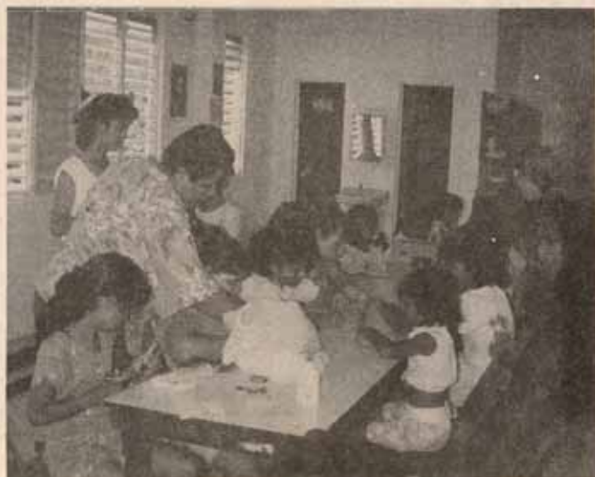
Maestros y niños en el Taller del Campamento de Verano Iglesia San Mateo de Peñuelas, P.R.