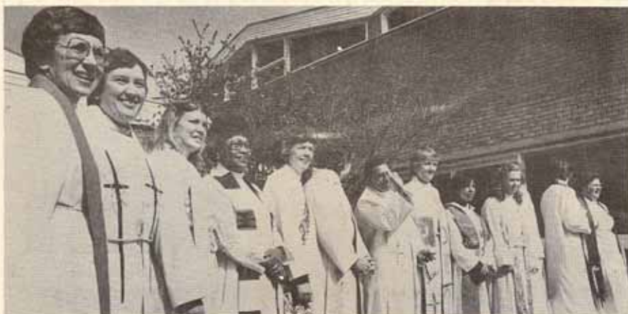
Mujeres Sacerdotes en Canterbury, Abril 19, 1986, frente al Colegio de Cristo (Christ College) en terrenos de Canterbury.

Londres nos recibió con su acostumbrado frío y lluvia. En lo que pernoctamos allí, esperando nuestra salida para