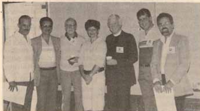
La delegación de Puerto Rico con el Obispo Primado de la Iglesia Episcopal en los Estados Unidos, el Illmo. Edmond Browning.