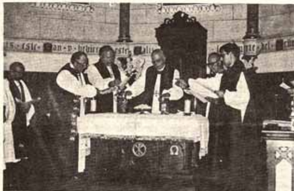
Concelebración eucarística en nuestra Iglesia Catedral, el domingo, 2 de noviembre.