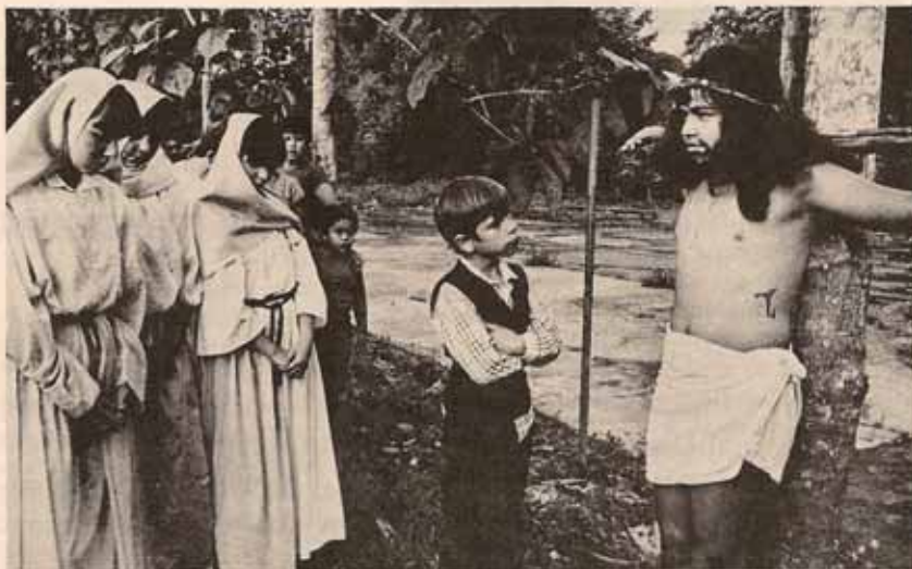
Vea crucis - Iglesia San José de Caimito.