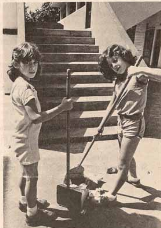
Campamento de verano San Justo.