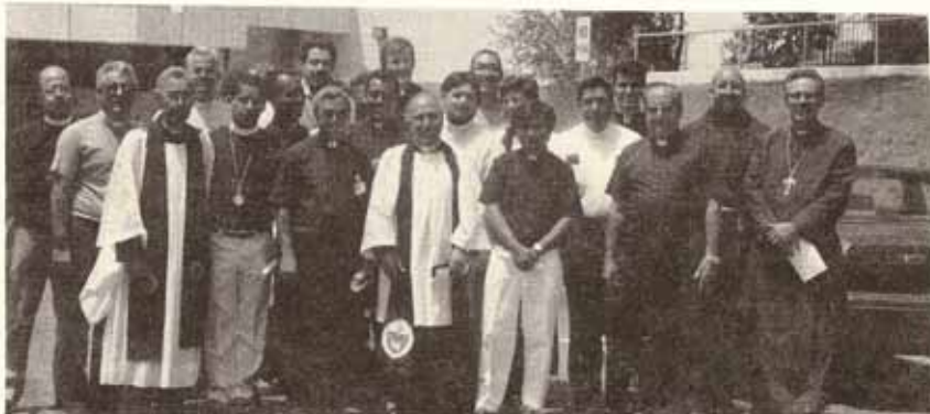
Grupo participante del Programa Clínico Pastoral