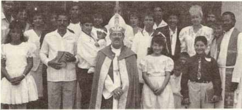
Visita del obispo a la Iglesia El Buen Pastor