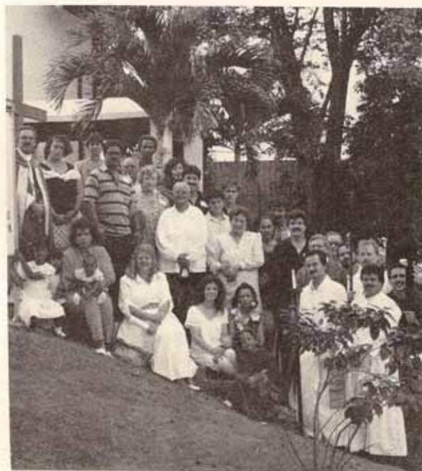
Visita del obispo a la Iglesia San Pedro y San Pablo