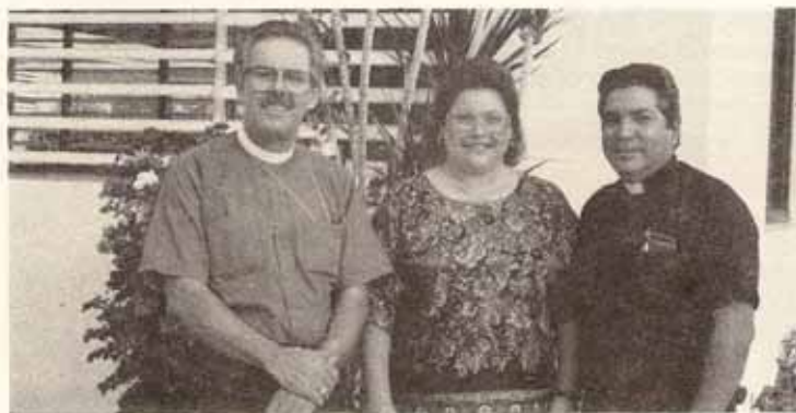
Visita pastoral Iglesia San Marcos