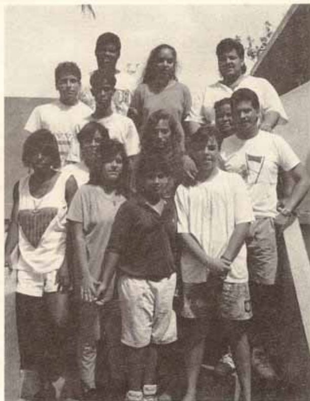
Grupo de jóvenes que participaron del intercambio entre la Diócesis de Puerto Rico y la Diócesis de Connecticut