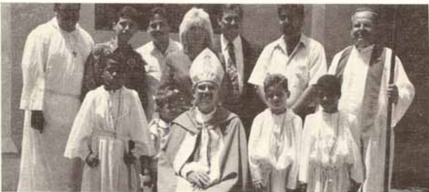
Visita del obispo a la feligresía de habla hispana de la Catedral