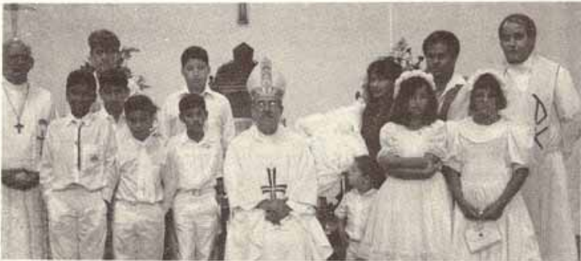
Visita del obispo a Stma. Trinidad