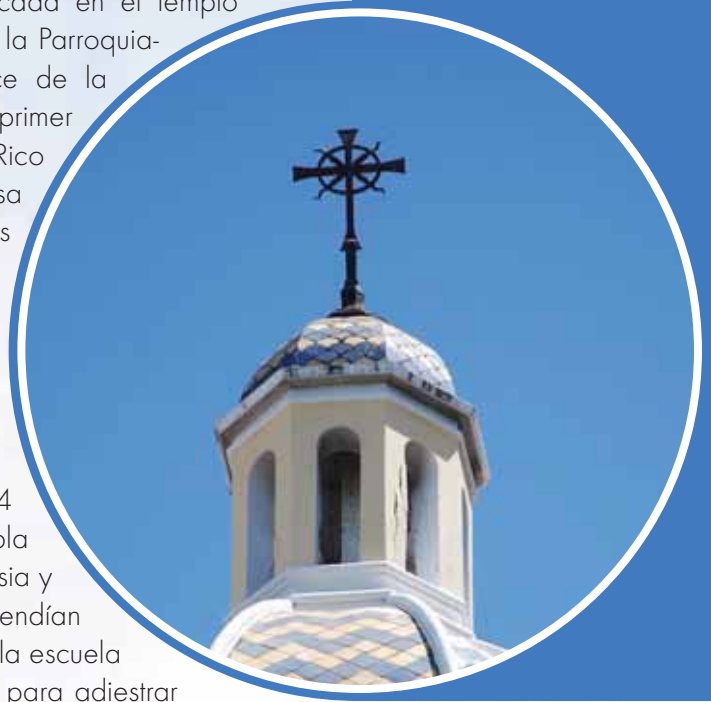
Cruz Celta de la Catedral Episcopal San Juan Bautista