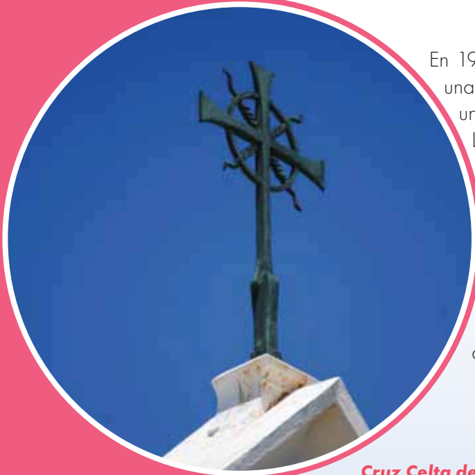
Cruz Celta de Templo Luterano San Pablo