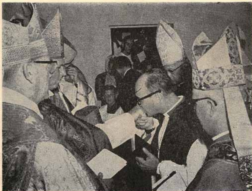
El Obispo Reus besa el anillo de Monseñor Lichtenberger, su consagrante.