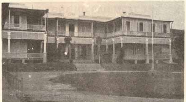
Antigua foto de cómo era el Hospital Episcopal San Lucas de Ponce, Puerto Rico.