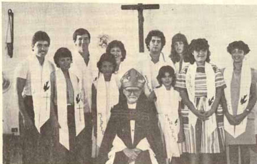
Visita Pastoral — Iglesia San Lucas, Ponce, Puerto Rico.