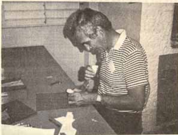
¿Es éste el pensador de Rodas?