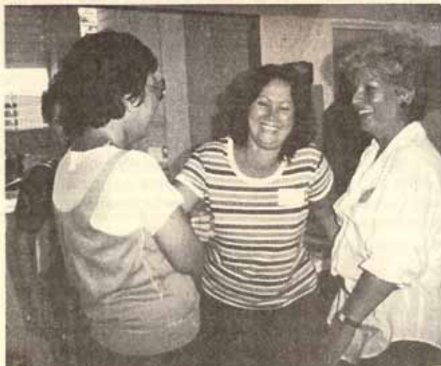
¿Conocen ustedes a estas damas risueñas?