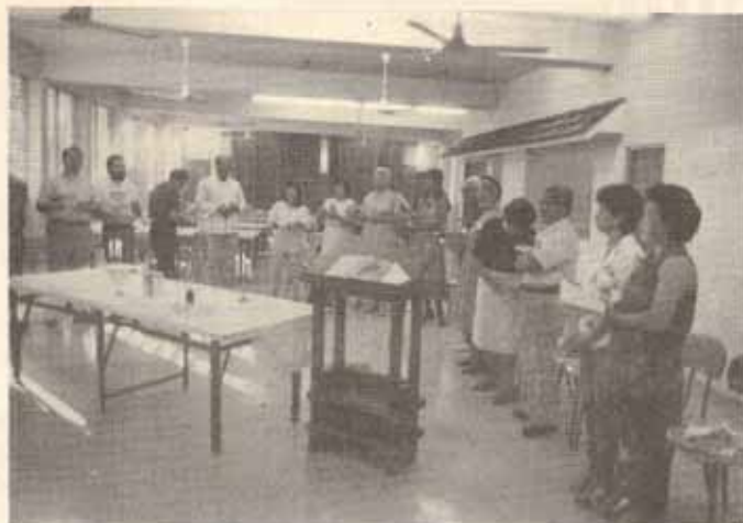
Conferencia del Sr. Obispo.