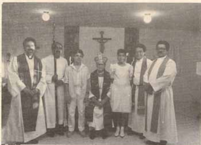
Visita Pastoral, Iglesia San Francisco de Asís, Carolina, P.R.