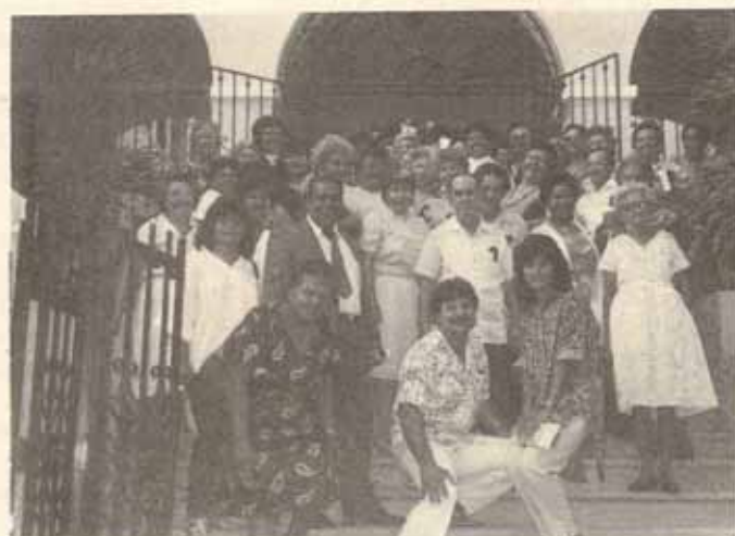
Congregación de Iglesia Santa María Virgen, Ponce, P.R.