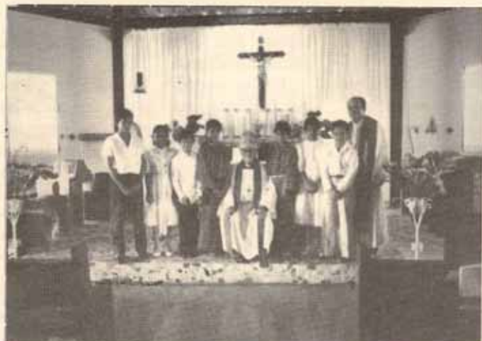
Visita Pastoral, Iglesia Santa Cruz-Castañer, P.R.