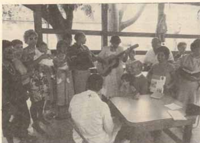
Visita Pastoral, Iglesia San Miguel, Ponce, P.R.