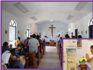
6 de enero Los Reyes Magos visitan la Misión La Transfiguración