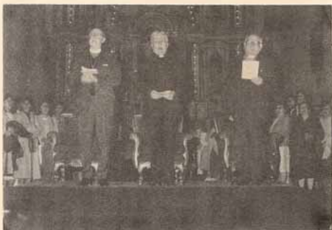
Oficio ecuménico. Consulta de Obispos y pastores en Cuenca, Ecuador en la Catedral El Sagrario. Obispo Reus, Arzobispo de Cuenca y Obispo Pagura Metodista.