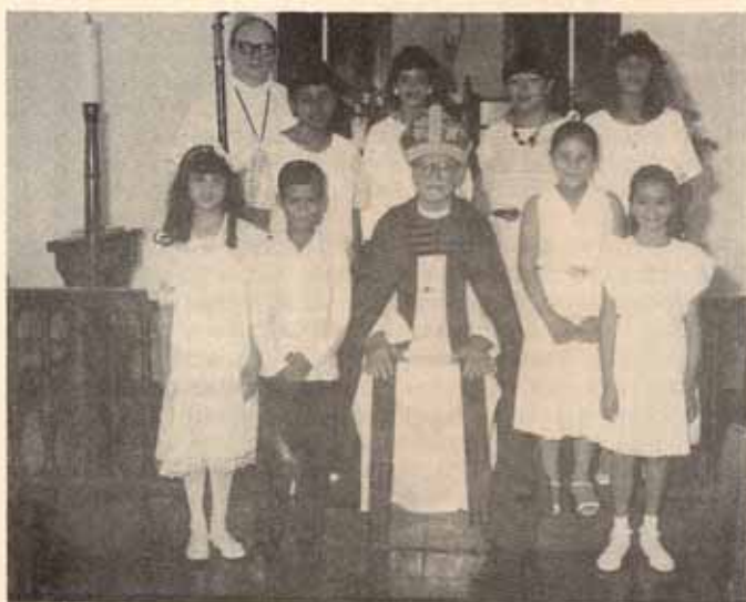
Visita pastoral, Iglesia Todos los Santos, Vieques, P.R.