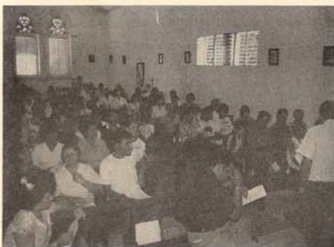
Visita Pastoral, Iglesia Santa María Virgen Ponce, P.R.