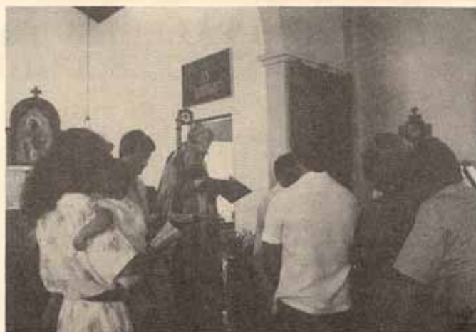
Juventud episcopal diocesana en el templo La Reconciliación Ponce, P.R.