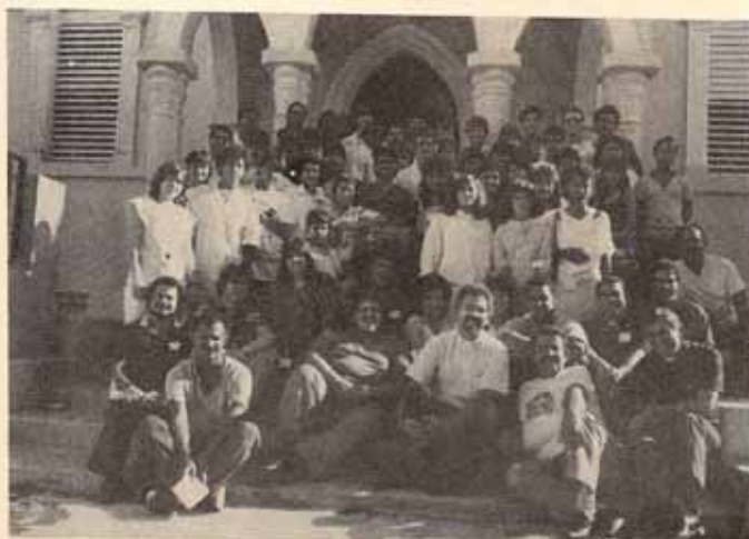
Participantes juventud episcopal diocesana celebrada en Iglesia La Reconciliación, Ponce, P.R.