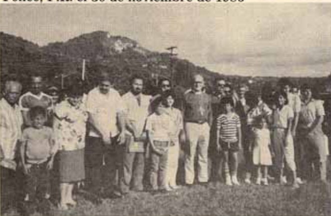
Vista parcial de feligreses que asistieron a Lares en la roturación y bendición del terreno para la construcción Iglesia San Matías, Lares, P.R.