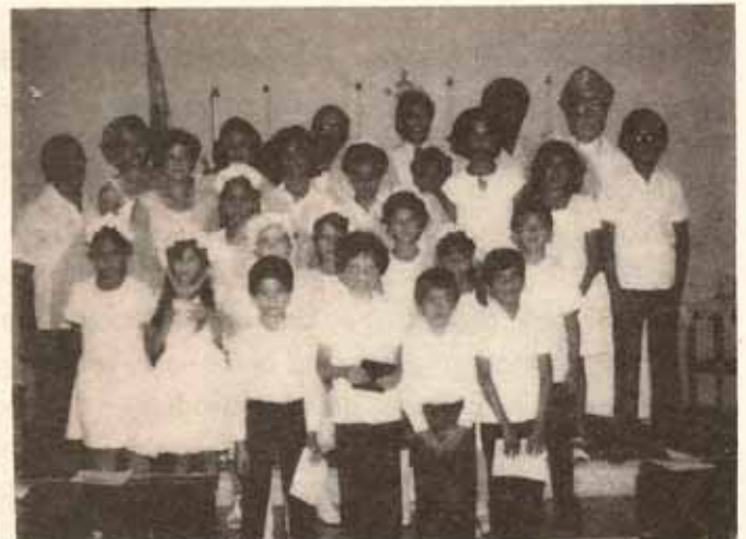
Confirmación - Iglesia Santísima Trinidad - Ponce, P.R.