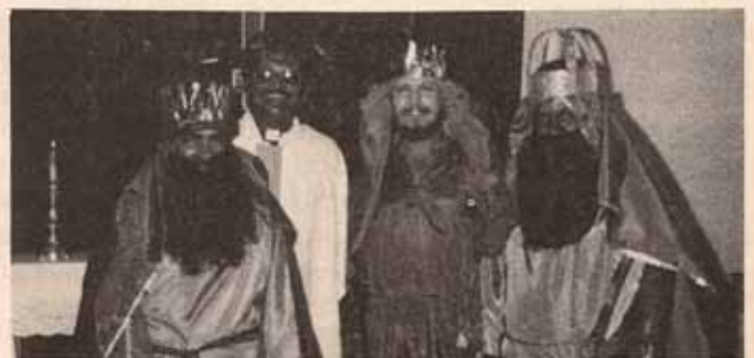
Padre del Valle y los Tres Santos Reyes en Caimito.