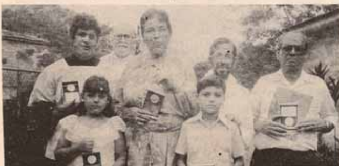
Premiación de ciudadanos y feligreses distinguidos durante Visita Pastoral a la Iglesia La Anunciación, Bo. Rancheras, de Yauco.