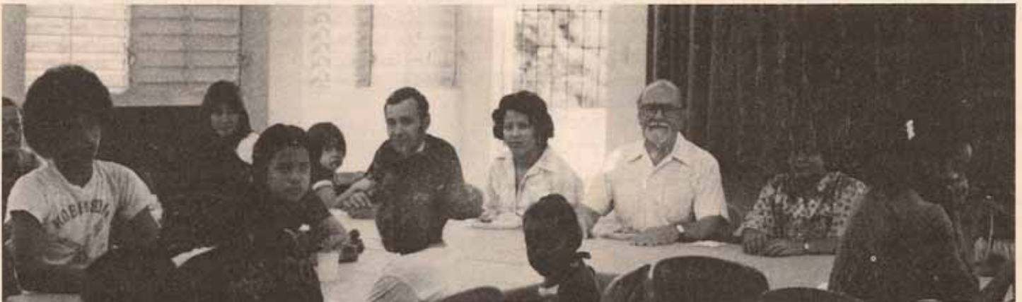
Asistentes a la Conferencia de Jóvenes Navideña.