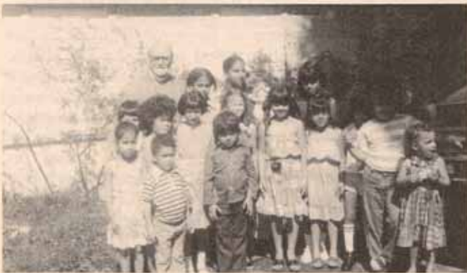
Visita Pastoral a Iglesia Sta. Hilda, Bo. Las Cuevas, Trujillo Alto.