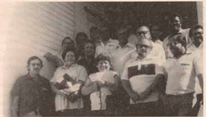
Oficialidad Diocesana durante reunión de planificación para 1979.