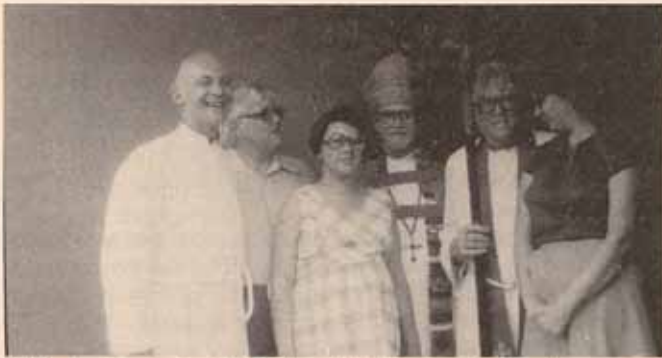
Visita Pastoral a la Iglesia San Esteban en Guayanabo.