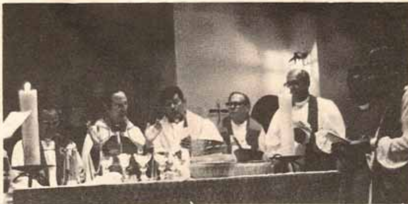
Los obispos concelebran la Eucaristía.

Los sínodos de la Provincia han ido consolidando el trabajo episcopal en esta vasta zona de América Latina que incluye a México, Guatemala, El Salvador, Honduras, Nicaragua, Panamá, Colombia, Ecuador, República Dominicana y Puerto Rico.