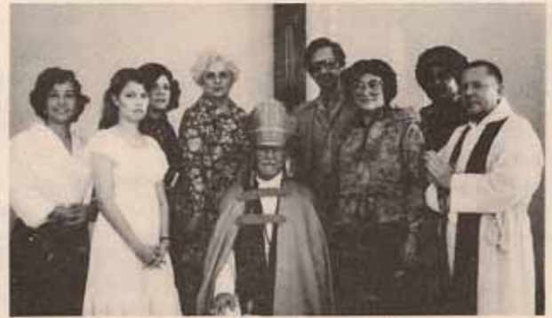
Visita Pastoral a la Iglesia S. Pedro y S. Pablo en Bayamón.