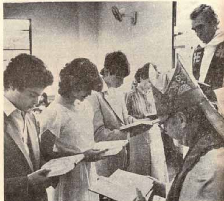
VISITA PASTORAL - IGLESIA SAN ESTEBAN URB. SAN RAMON, GUAYNABO, P.R.