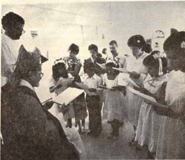
VISITA PASTORAL - IGLESIA SANTO NOMBRE DE JESUS BO. PASTILLO, PONCE, P.R.