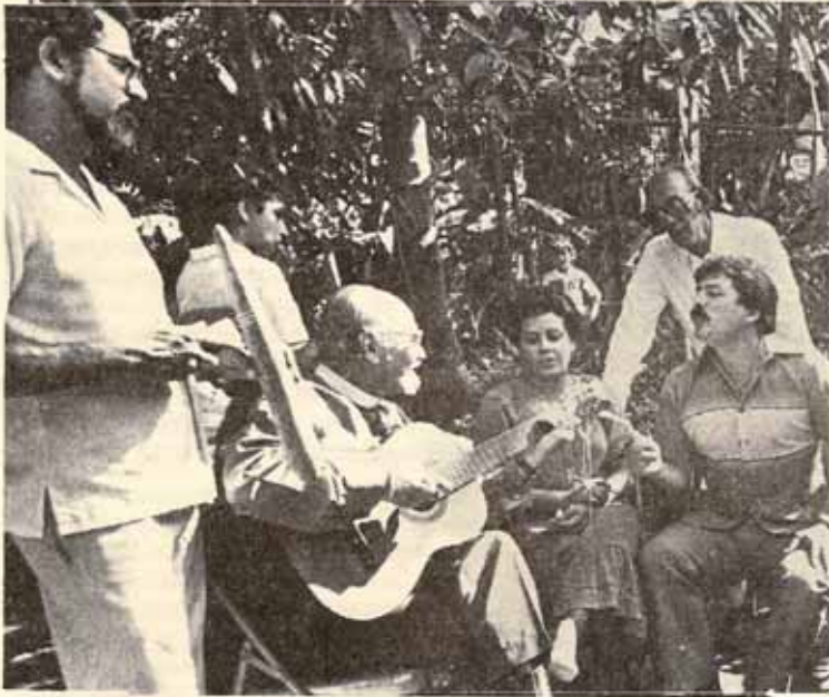
VISITA PASTORAL - IGLESIA LA RECONCILIACION BO. QUEBRADA LIMON, PONCE, P.R.