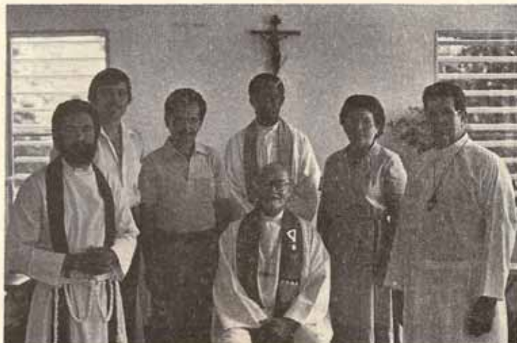
Visita Pastoral Iglesia Santa María Magdalena, Levittown.