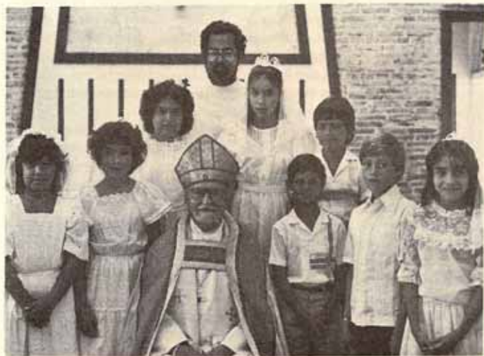
Visita Pastoral Confirmación Iglesia La Reconciliación, Bo. Quebrada Limón, Ponce.