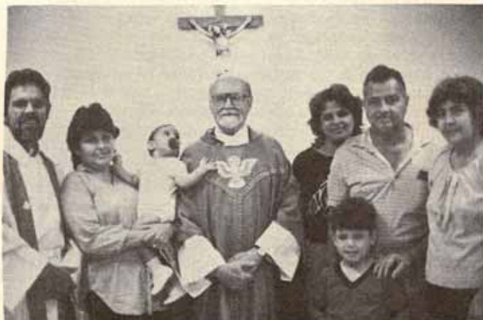
Visita Pastoral Recibidos Iglesia Santa Hilda, Trujillo Alto.