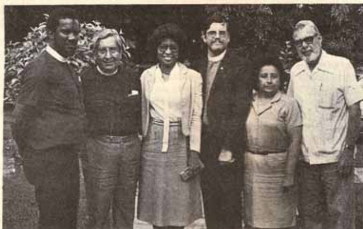
Miembros del Tribunal de Apelaciones de la Novena Provincia en visita a Puerto Rico en enero pasado.

DONDE ABUNDA EL AMOR, OCURREN GRANDES MILAGROS.