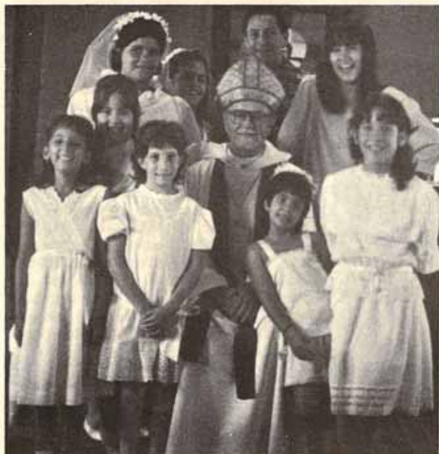
Visita Pastoral Confirmación Iglesia Santo Tomás, Barrio Martín González, Carolina.