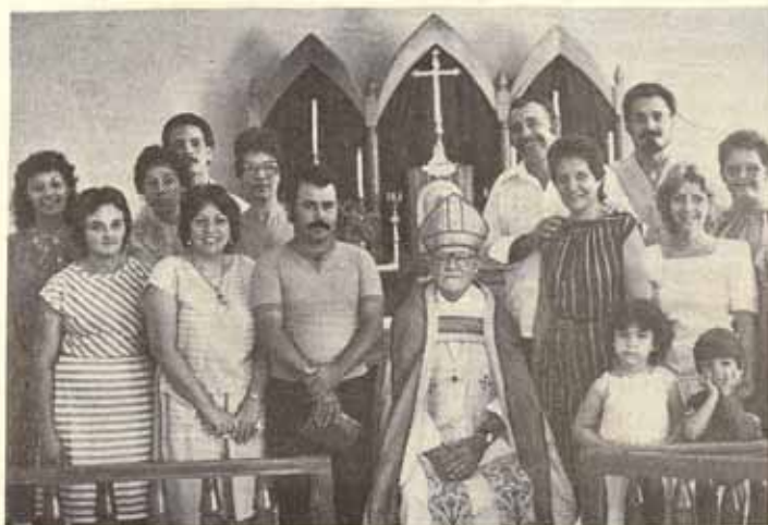
Visita Pastoral, Iglesia La Ascensión, Morovis.