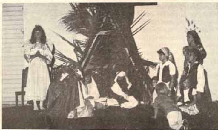
Actividad de Navidad, Iglesia San Pablo, Arecibo, P.R.