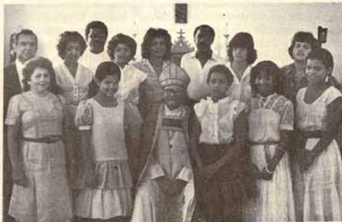
Visita Pastoral, Iglesia Sagrada Familia St. Just, Trujillo Alto.