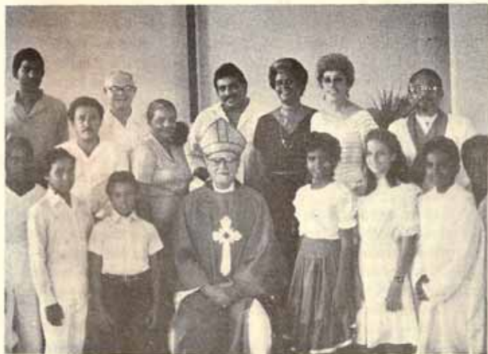
Visita Pastoral Iglesia Buen Pastor, Fajardo.