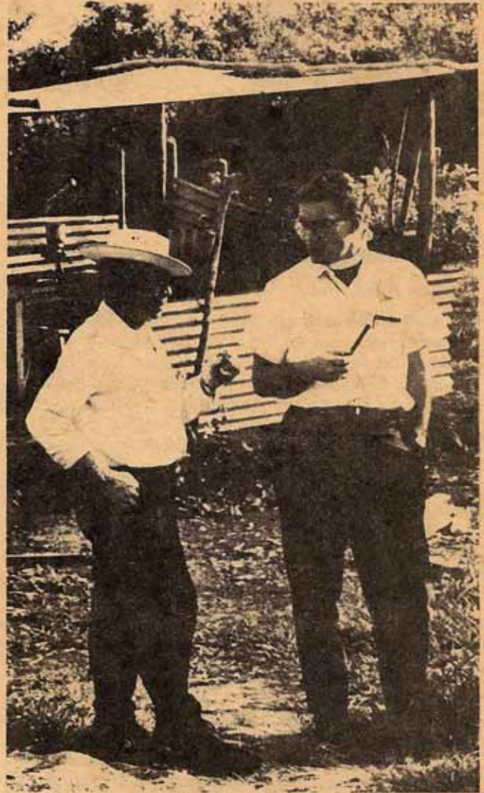
El Obispo Frey, primer Obispo de Guatemala, conversa con uno de los empleados del Programa Life (Vida) acerca de la construcción de una nueva casa en el área de San Felipe.