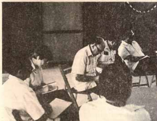
Taller Análisis Transaccional para Capellanes Hospital de Caguas. Se llevó a cabo en la Iglesia Episcopal Cristo Rey de Caguas.