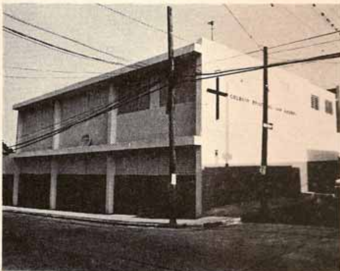
Nuevo edificio escolar de la Iglesia Episcopal San Andrés, Mayagüez

De acuerdo a los registros parroquiales, la Iglesia Episcopal se establece oficialmente en Mayagüez en el año 1906. Desde su fundación ha ofrecido a la comunidad diferentes servicios como talleres de artesanía, escuela de bordado y carpintería, dispensario médico y servicios educativos.