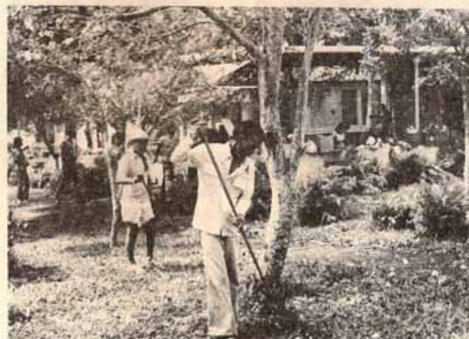
Residentes de Villa sin Miedo limpiando alrededor del Centro San Justo.