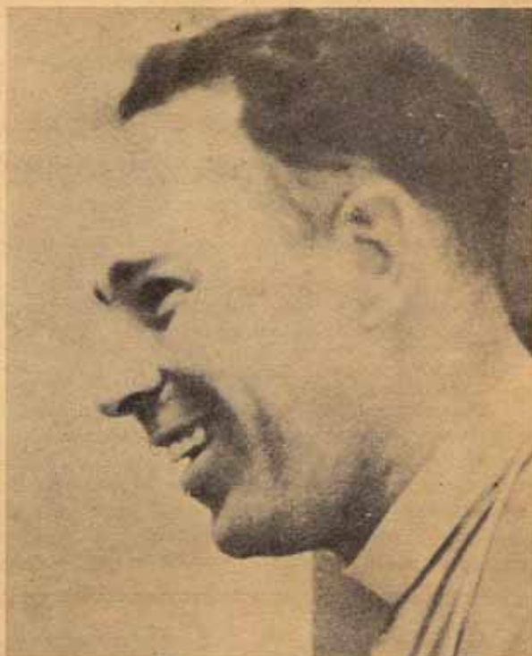
El obispo David B. Reed, diocesano de Colombia de nuestra Iglesia Episcopal, en reciente carta pastoral ha dicho, entre otras cosas:

"Siempre hemos pensado que nuestro apostolado consistía, principalmente, en invitar a la masa de católicos no practicantes, a nuestra Iglesia. Pero sinceramente, la mejor contribución posible que podemos aportar a este país, es la de ayudar a que crezca la Iglesia que en él predomina", agregando, "ciertamente algunas personas no volverán jamás a la Iglesia Católica Romana, y a ellas debemos acogerlas espiritualmente, conducir las al Señor y a Sus Sacramentos".