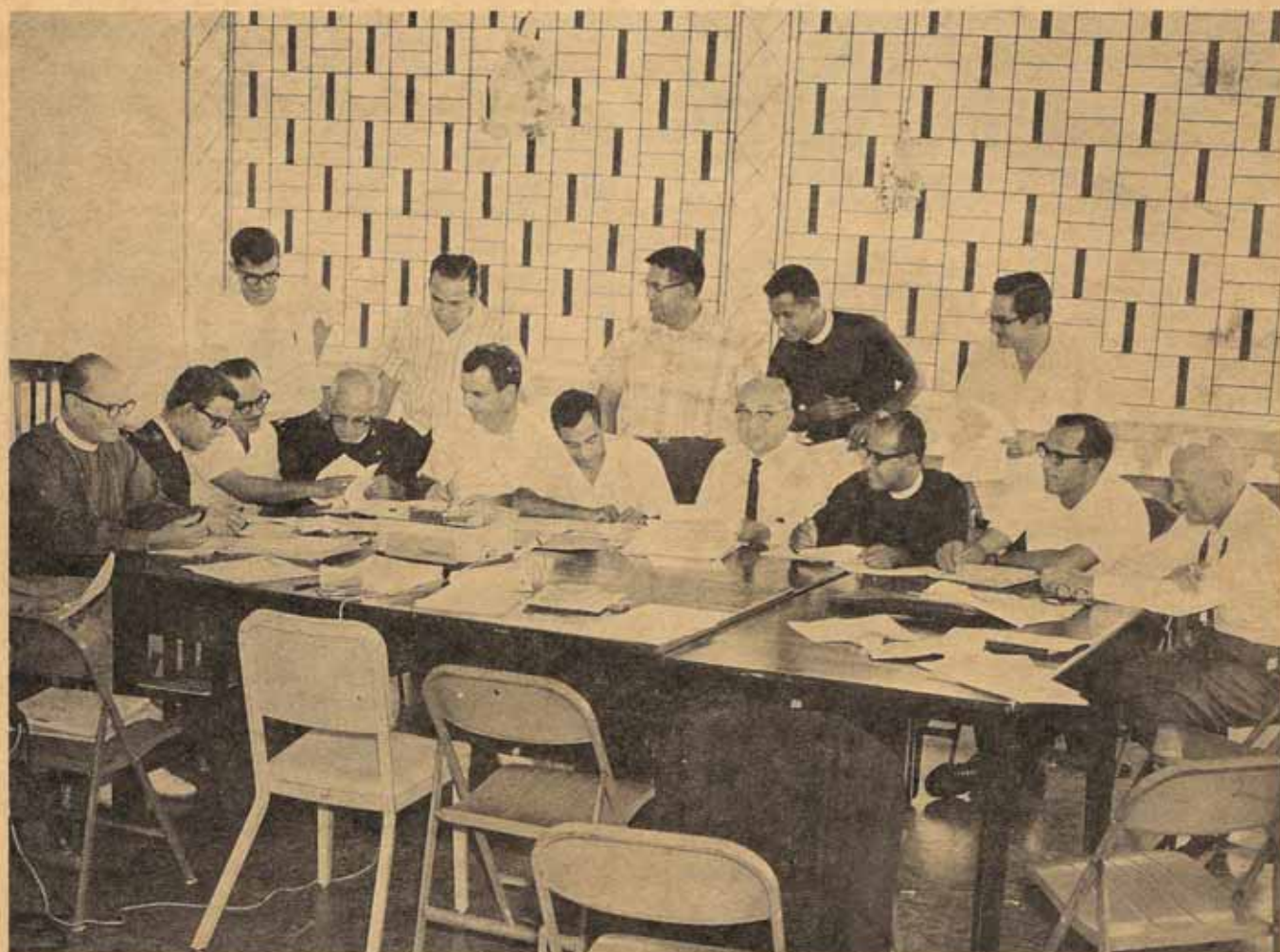
La Comisión Conjunta de Estrategia Diocesana, del Programa Piloto, en reunión.

Editorial y Artículos sobre el Programa Piloto.