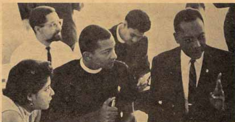
Delegados al Sínodo durante una de las sesiones.