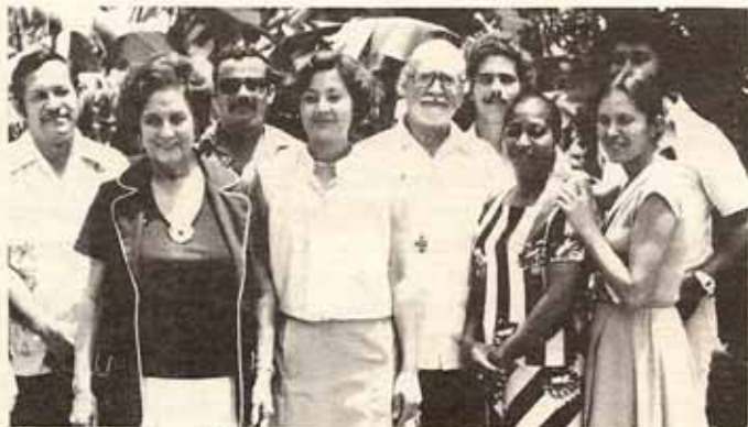
Directores de los diferentes Centros, el Obispo Reus, presidente de la Junta y empleados de la Oficina Central en San Justo.

A pesar de las limitaciones de distintas índoles, el Programa ha obtenido logros muy significativos en las distintas áreas de servicios.