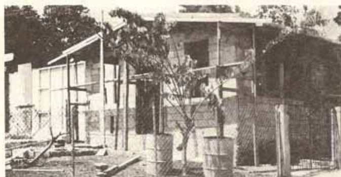
Construcción de nuevo edificio para la Iglesia Sto. Nombre de Jesús en el Bo. Pastillo de Ponce.