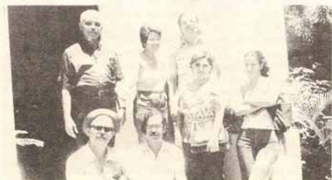
Personal de la Oficina Diocesana en Pasadía a Vieques del Día de la Secretaria.