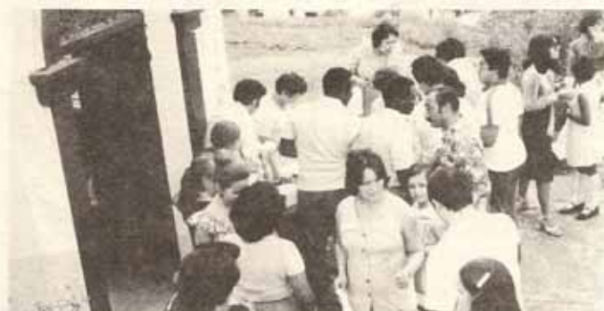
Visita Pastoral y la Iglesia San Marcos en el Bo. Magueyes de Ponce.