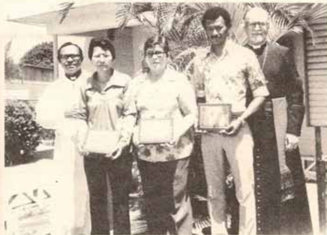
PLACAS DE RECONOCIMIENTO:

Luego disfrutamos todos de una suculenta comida prepa- rada por las Damas de la Iglesia.