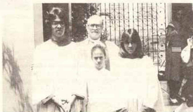
Visita Pastoral del Obispo a la Escuela de la Catedral.