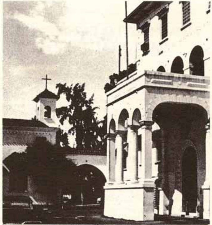
Entrada principal del hospital y la capilla