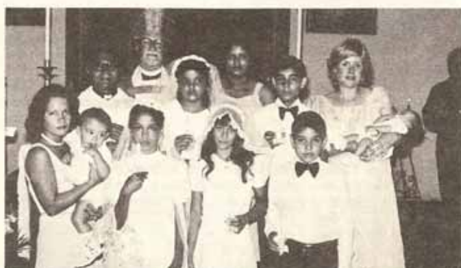
Visita Pastoral del Obispo a la Iglesia La Resurrección en Manatí.