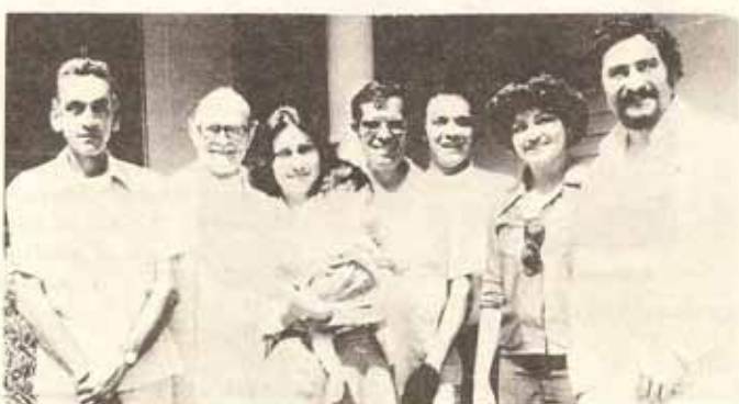
Confirmados y Recibidos en la Iglesia San Rafael en Yacuo.