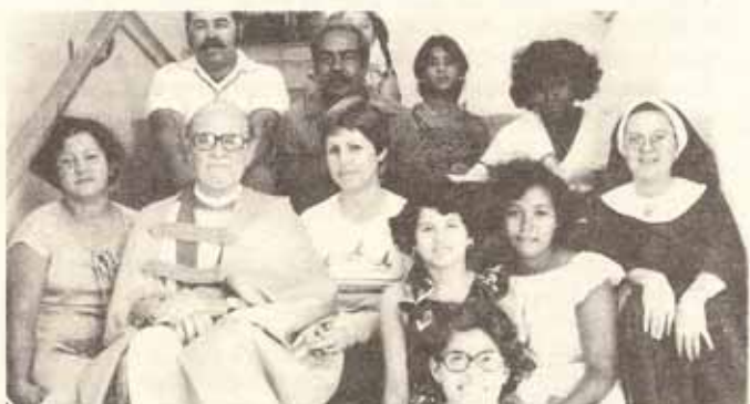
Grupo de Confirmación y Recepción en Visita Pastoral a la Iglesia San Lucas en Ponce.