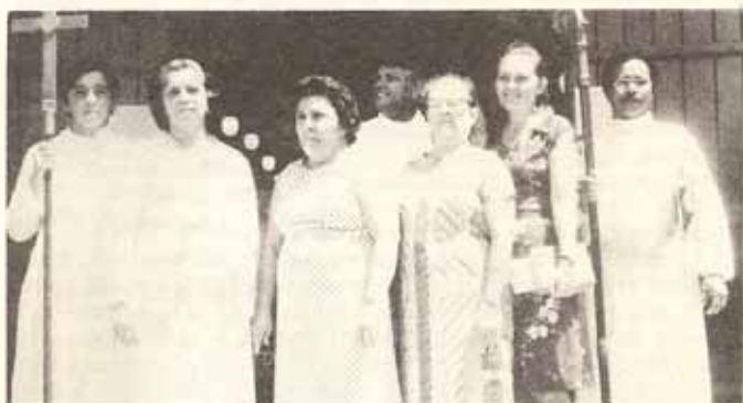
Visita Pastoral a la Iglesia El Buen Pastor en Fajardo.