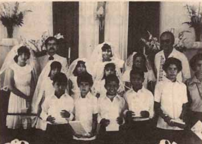
Visita Pastoral a la Iglesia San Marcos, Bo. Magüeyes, Ponce.