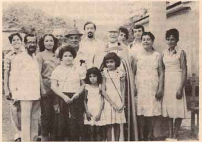
Visita Pastoral a la Iglesia La Anunciación, Bo. Rancheras, Yauco.