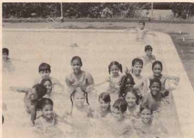
Participantes en Campamentos de Verano del Centro San Justo.