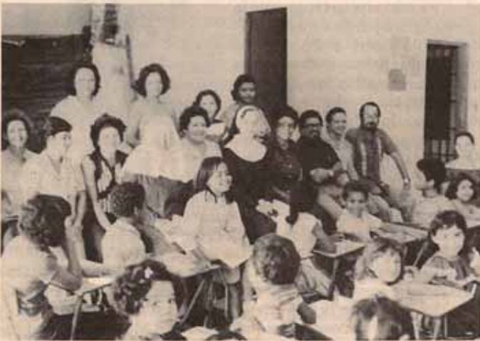
Participantes en Taller Sobre Educación Cristiana celebrado en Ponce.