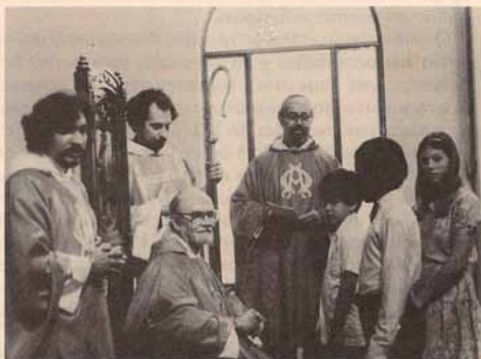
Visita Pastoral a la Feligresía de Habla Inglesa de la Catedral.