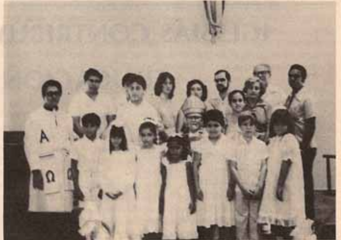
Visita Pastoral a la Iglesia La Encarnación, Roosevelt, Hato Rey.