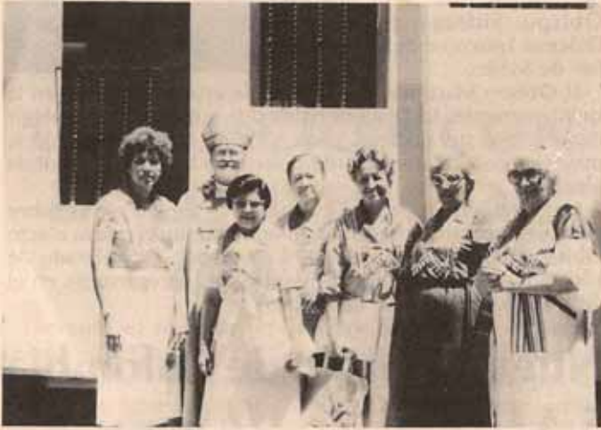
Nueva Directiva de la Sociedad de Damas Episcopales.