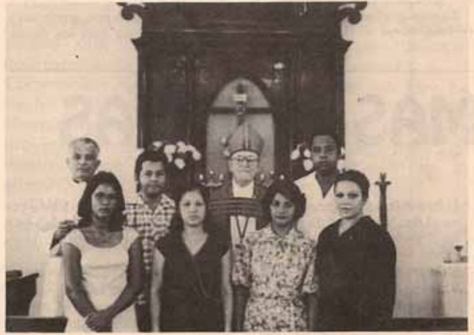
Visita Pastoral a la Iglesia Todos los Santos en Vieques.