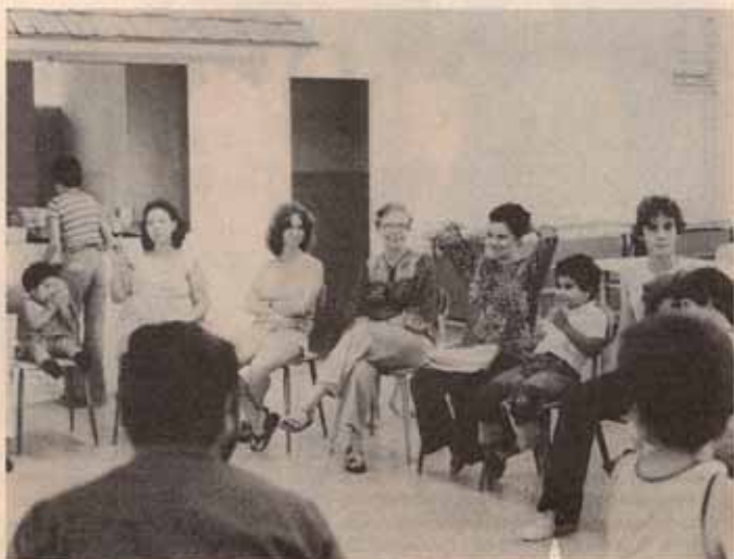
Parte de los asistentes a la actividad del Clero y familias.