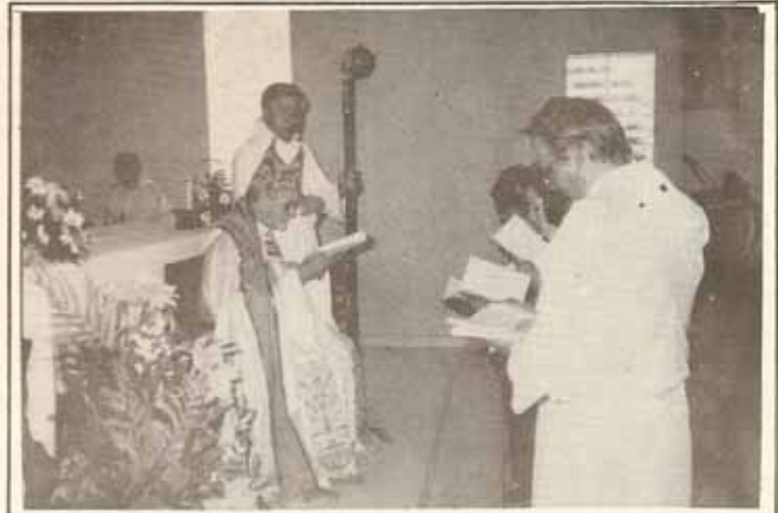
VISITA PASTORAL Iglesia La Encarnación, Hato Rey, P.R.