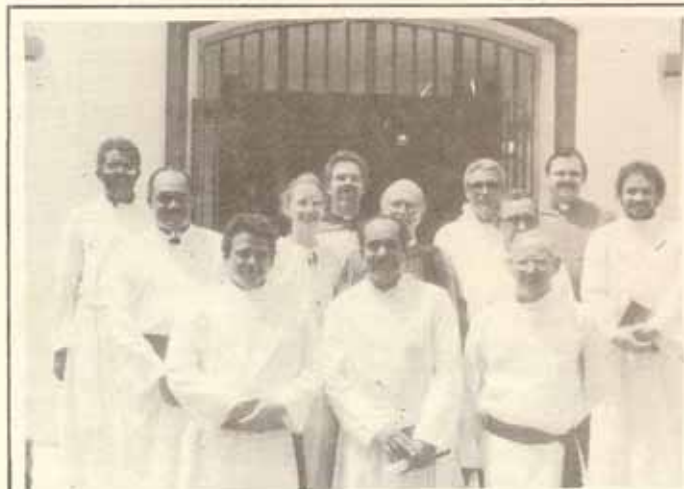
Estudiantes y profesores del Programa ESTUDIO de formación teológica de nuevos sacerdotes en nuestra Diócesis, durante la graduación el pasado 23 de mayo 1987 en la Iglesia Sagrada Familia de Saint Just, P.R.