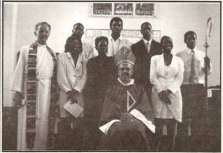
Confirmaciones en Visita Pastoral Catedral S. Juan Bautista (Inglesa), Santurce