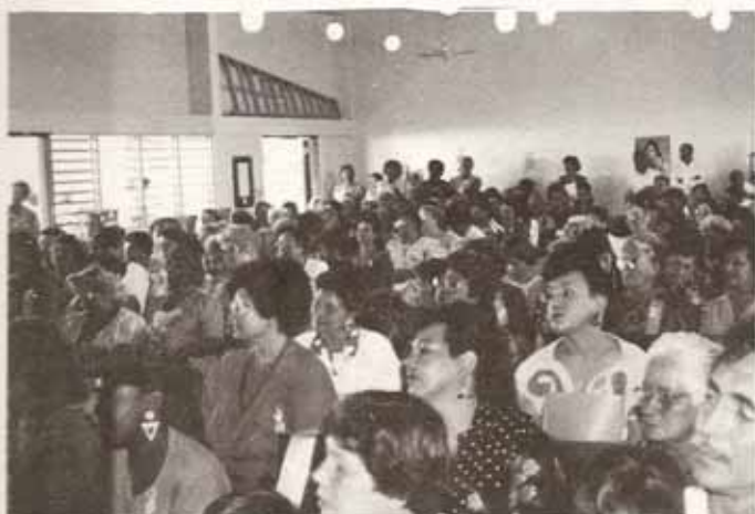
Vista parcial de la asistencia a la Convención de las Mujeres Episcopales celebrada en la Parroquia Cristo Rey, Caguas