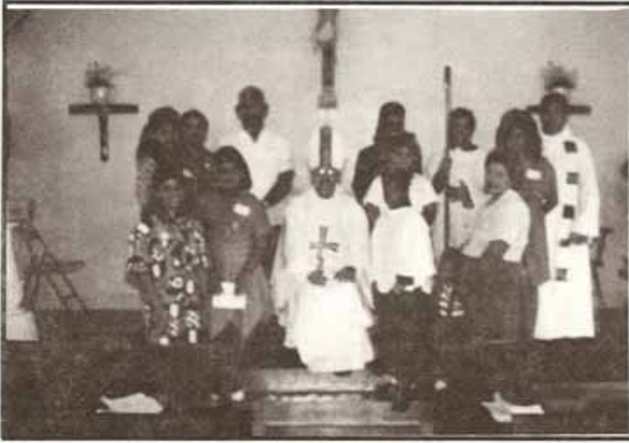
Visita Pastoral iglesia San Marcos, Ponce