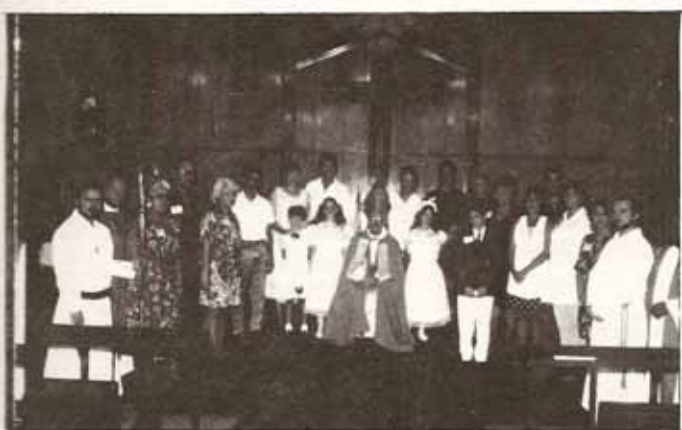
Llena a capacidad estuvo la Visita Pastoral a S. Pedro & S. Pablo, quienes además bendijeron un nuevo retablo, sagrario e intronizaron las imágenes de los Santos patronos, el miércoles anterior a dicha Visita.