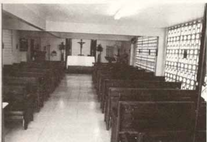
Nuevos bancos y nueva fachada en la iglesia San Francisco de Asís, Río Piedras. ¡Vengan y vean!