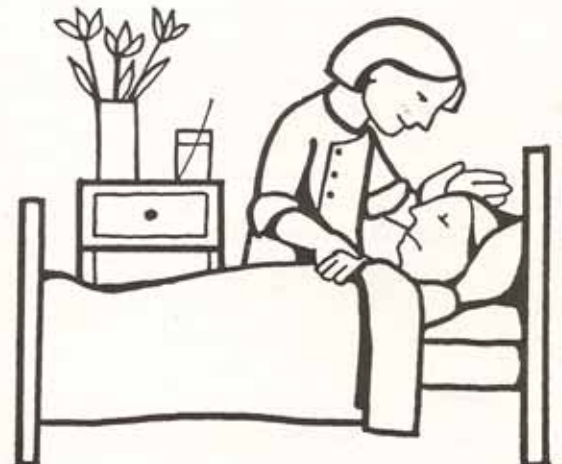
visitando a los enfermos