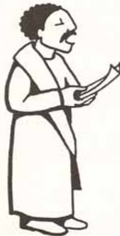
proclamando el Santo Evangelio

El Diácono ayuda al Sacerdote en la administración de los Sacramentos y en otros ministerios