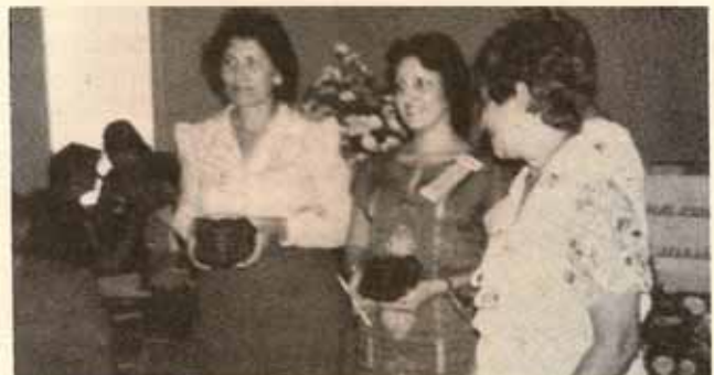
Misiones de San Marcos y San José de Caimito reciben placas por mejor asistencia.