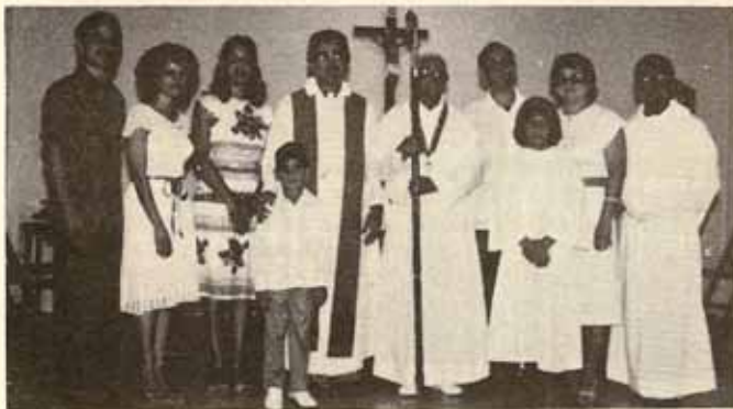
Visita Pastoral, Iglesia Sta. Hilda, Bo. Las Cuevas, Trujillo Alto