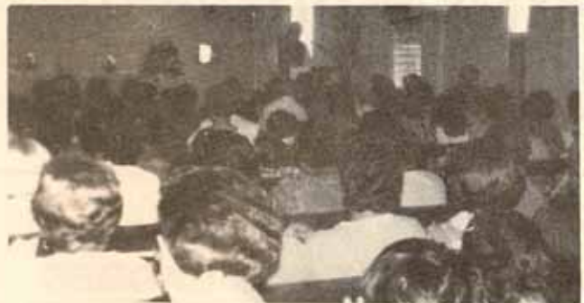
El Sr. Obispo se dirige aparte a las mujeres durante la eucaristía