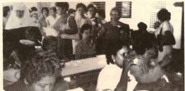
Las mujeres comparten durante el desayuno.