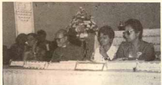
La Sra. Troche rinde su informe de actividades