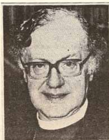
Arzobispo Robert Runcie

Como ha quedado demostrado por las acusaciones, las personas que alegadamente cometieron fraude contra Medicare, actuaron en forma personal y en ningún momento tuvieron el apoyo de la Junta del Programa ni de los oficiales de la Iglesia. El Programa espera continuar sirviendo a la comunidad puertorriqueña en general con servicios profesionales y de alta calidad, lo cual lo lleve a lograr su única razón de ser que es el ser de ayuda en atender las necesidades de salud de las personas necesitadas.