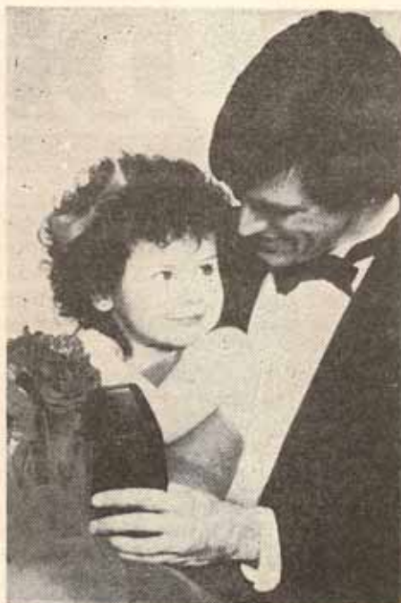
figura que inspire amor y comprensión, aceptación y confianza.

Lo opuesto son los padres muy autoritarios quienes desgraciadamente no saben ejercer el poder. Son excesivamente duros e inflexibles. Se olvidan que para disciplinar, educar y guiar, además de límites y normas de conducta, es necesario el ejemplo de una