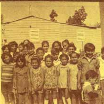
Grupo de la Iglesia San Juan, Bo. Barinas, Yauco.