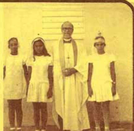
Visita Pastoral en San Juan, Barinas.