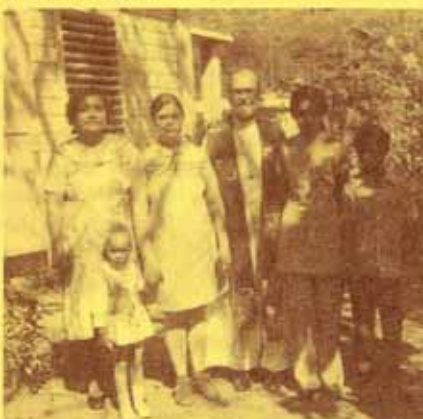
Confirmación en Santa Cecilia, 4 marzo 1973.