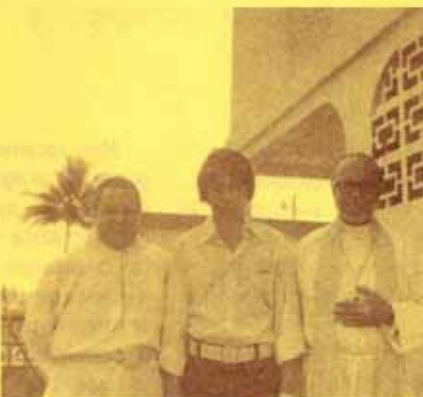
En Santa María Magdalena, confirmación solemne y nutrida.