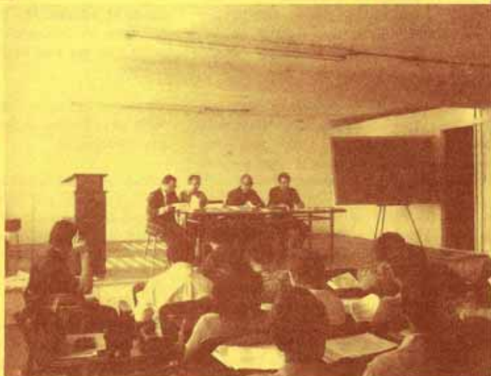
Presidencia en una de las sesiones de la pasada convocación diocesana.