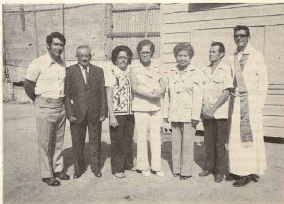
JUNTA PARROQUIAL - Iglesia Sta. María Virgen, Ponce