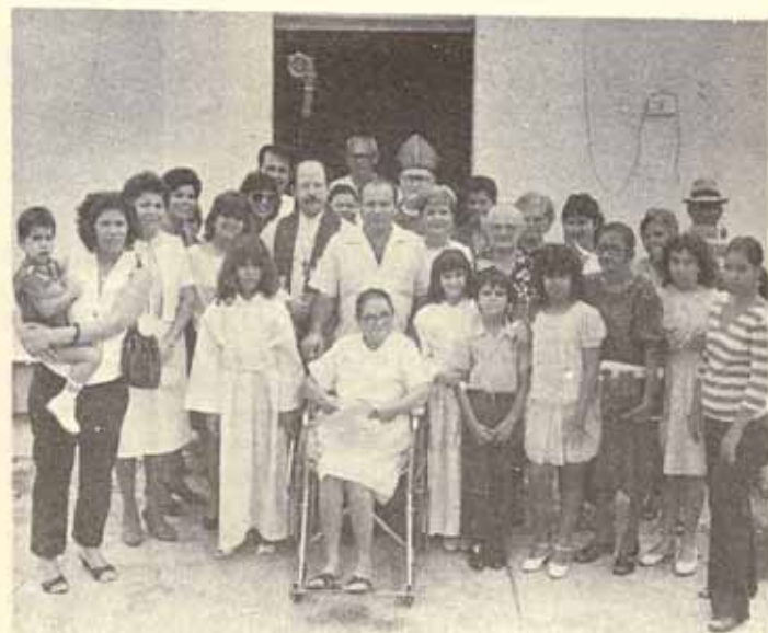
Visita Pastoral Iglesia San Mateo Peñuelas, P.R.