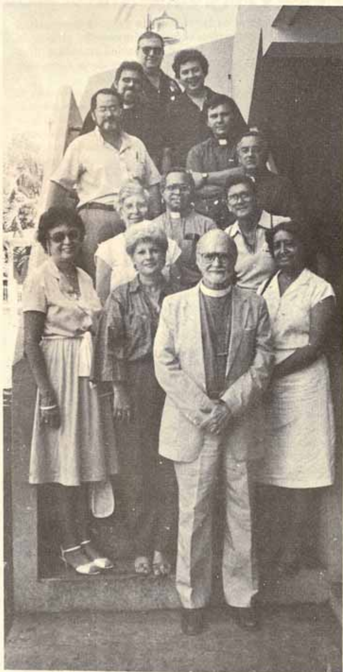
Miembros Asociación Escuelas Episcopales