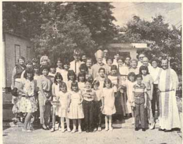
Visita Pastoral Iglesia Santo Nombre de Jesús Bo. Pastillo, Ponce, P.R.