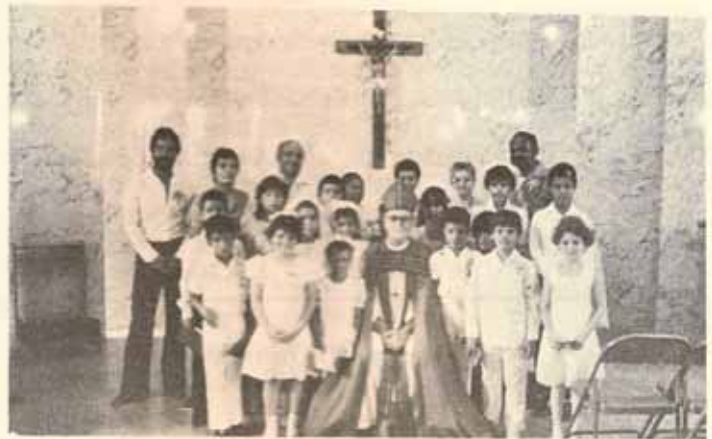
Visita Pastoral y Confirmación Iglesia San Miguel Arcángel Ponce, P.R.