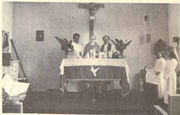
Iglesia San Mateo Peñuelas, P.R.