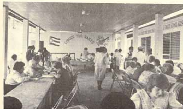
Fiesta de la feligresía Iglesia San Rafael Arcángel Yauco, P.R.