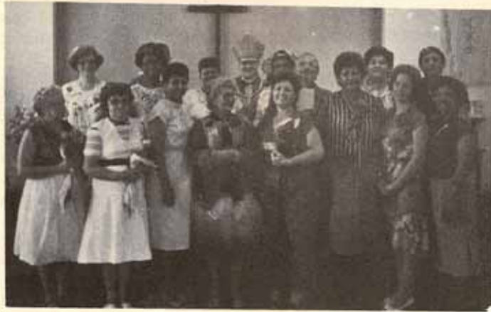
Sociedad Damas Iglesia Buen Pastor Fajardo, P.R.