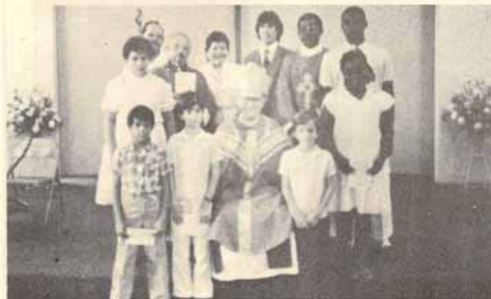
Visita Pastoral y Confirmación Iglesia Buen Pastor Fajardo, P.R.