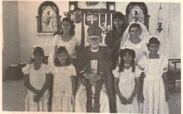
Visita Pastoral y Confirmación Iglesia Santa María Virgen Ponce, P.R.