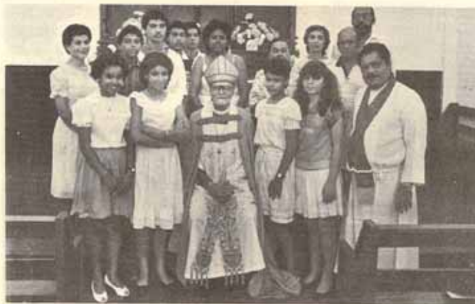
Visita Pastoral Iglesia San Rafael Arcángel Yauco, P.R.