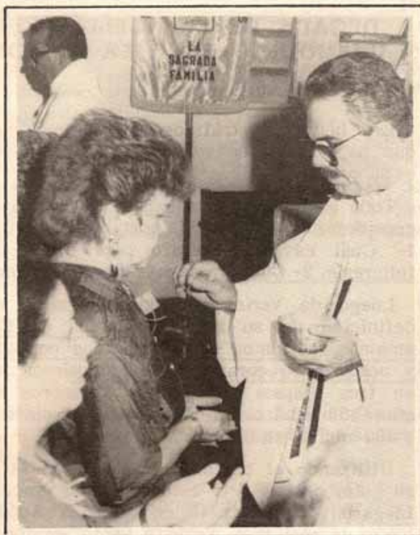
Visita Pastoral Iglesia La Sagrada Familia