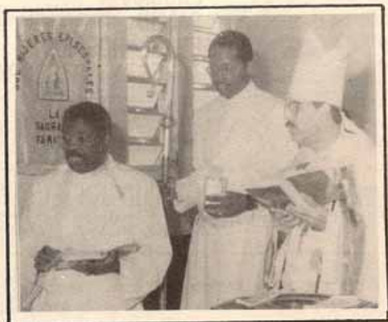
Visita Pastoral Iglesia La Sagrada Familia