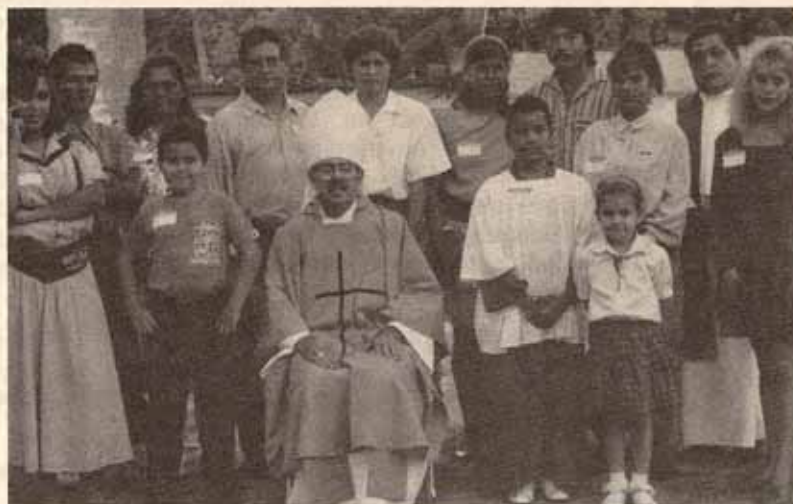
Visita Pastoral Iglesia San Juan Evangelista