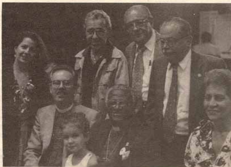
Delegación de Puerto Rico al XI Sínodo de la IX Provincia junto al Arzobispo Desmond Tutu en Honduras