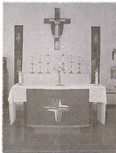
Altar de la iglesia Sagrada Familia en Trujillo Alto.

Este rito y devoción es especialmente apropiado para el Jueves Santo y otros jueves en conmemoración de la Institución del Santísimo Sacramento del Altar.