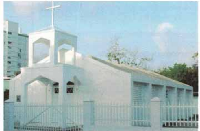
Nuevo templo de la Misión San Miguel Arcángel.

En el lugar sagrado que amaron hay un lugar de descanso eterno.