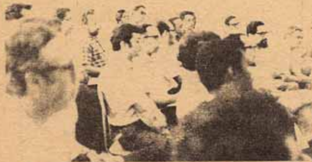
Participantes de la Conferencia en Sesión Plenaria.