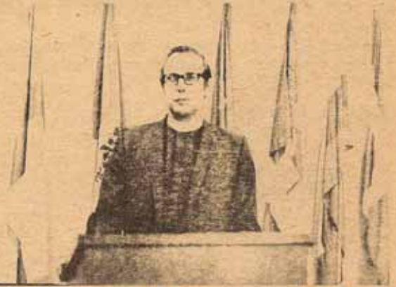
El Muy Rev. William P. Haugaard, Dean del Seminario Episcopal del Caribe.

Al hablar del Anglicanismo en la América Latina tenemos el problema de las realidades de la Iglesia y del Mundo Latinoamericano, llegamos a la conclusión que no hay una comunicación positiva en esas realidades, tanto locales como regionales, para la cual no corresponde la realidad de la Iglesia. No hay comunicación del Anglicanismo con las realidades de la América Latina. Vemos esto como un signo de peligro en cuanto al papel del Anglicanismo en la América Latina.