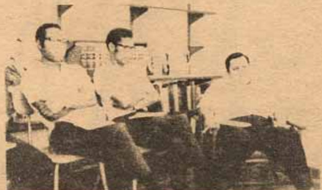
Grupos de discusión.