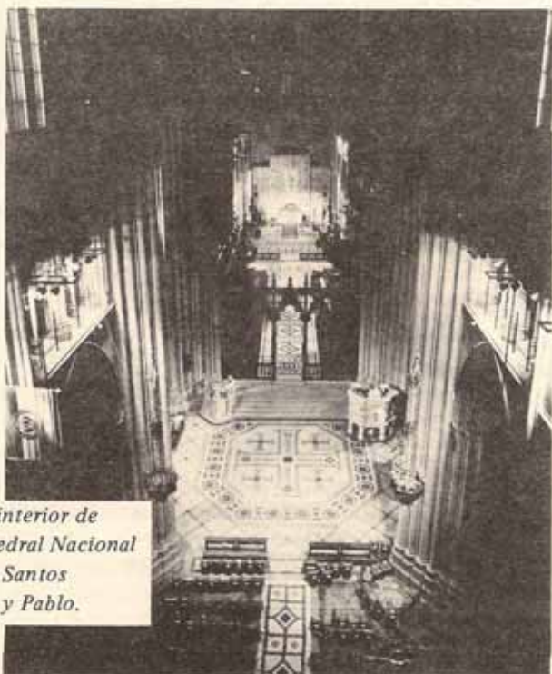
Vista interior de la Catedral Nacional de los Santos Pedro y Pablo.