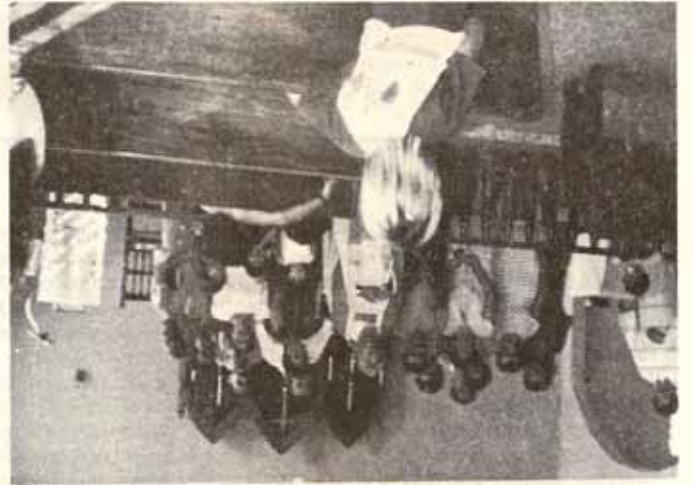
VISITA PASTORAL Iglesia La Ascension de Barahona, Morovis, P.R.