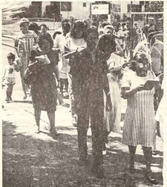
Procesión Domingo de Ramos en la Iglesia Santo Tomás, Barrio Martín González, Carolina, Puerto Rico.