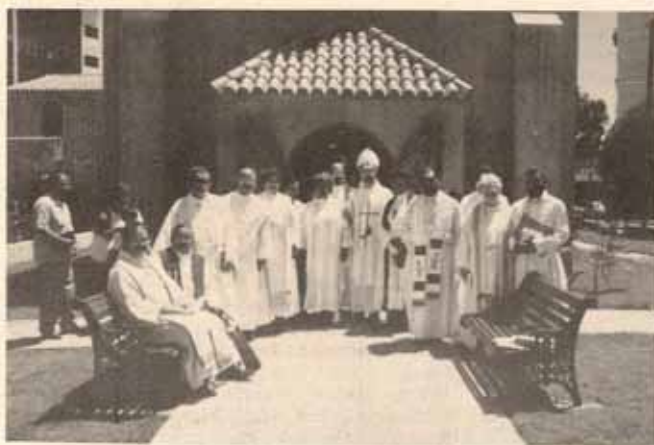
Renovación promesas sacerdotales del clero sur y oeste, en la Iglesia Santísima Trinidad Ponce, P.R. el día de Jueves Santo.