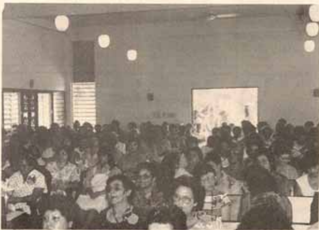
Vista parcial de la asistencia de la Convención de Mujeres Episcopales en Fajardo, P.R.