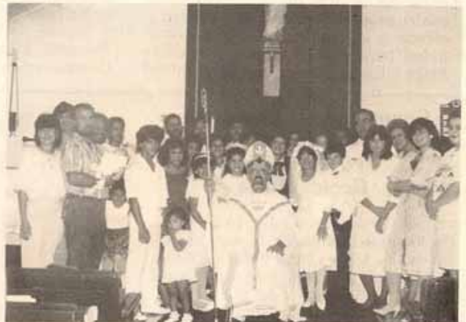
Bautismos, confirmaciones y recepciones en visita pastoral del Obispo Alvarez a la Iglesia La Resurrección en Manatí, P.R.