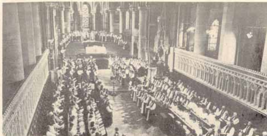
Service at the 1978 Lambeth Conference

La Conferencia de Lambeth es un brazo al servicio de la iglesia. Tiene cuatro propósitos principales, a saber: 1. ofrecer a los participantes una oportunidad para orar, consultar y analizar entre ellos; 2. proveer una oportunidad