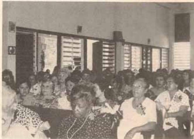
Convención Anual de las Mujeres Episcopales en el mes de abril 1988 en la Iglesia El Buen Pastor de Fajardo, P.R.