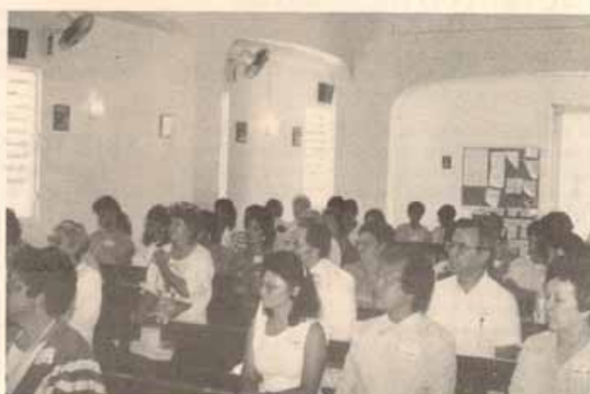
Participantes Convención anual de Escuelas Episcopales en la Iglesia La Encarnación Bo. Roosevelt, Hato Rey, P.R.