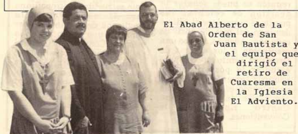
El Abad Alberto de la Orden de San Juan Bautista y el equipo que dirigió el retiro de Cuaresma en la Iglesia El Adviento.

La foto sobre estas líneas capta a un grupo de fieles durante la pasada visita pastoral.