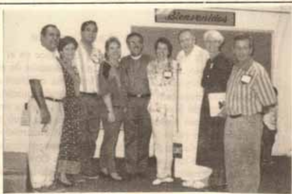
Pareja presentadoras de P.R. y EEUU durante pasado Encuentro Matrimonial