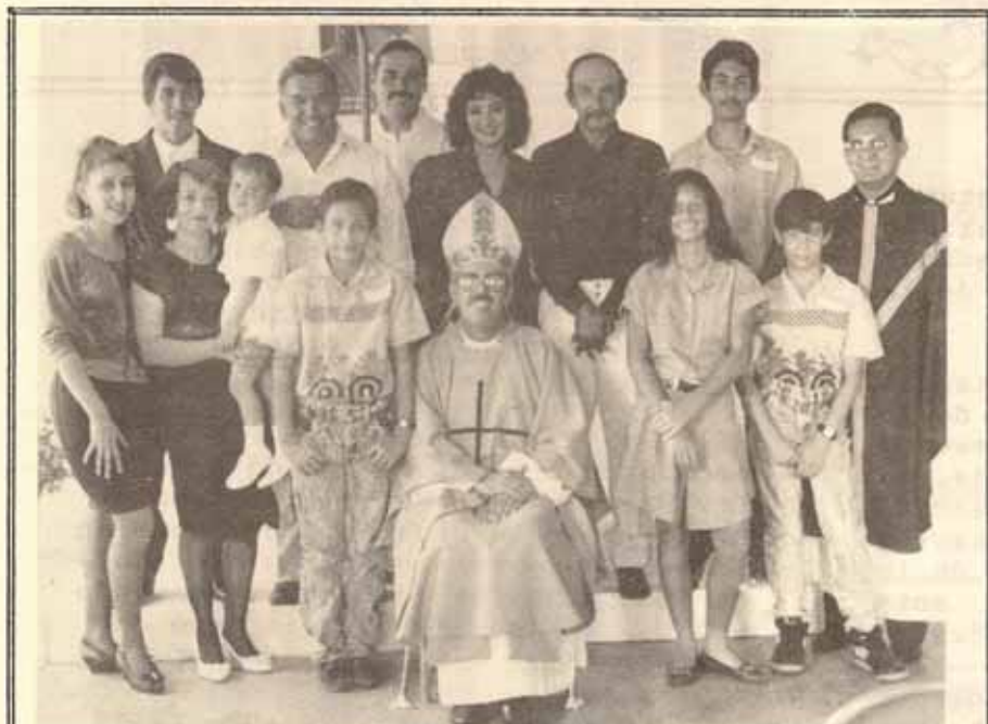
VISITA PASTORAL IGLESIA SAN MATIAS, LARES, P.R.