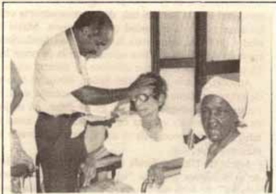
Día del Envejeciente Iglesia San Francisco de Asís