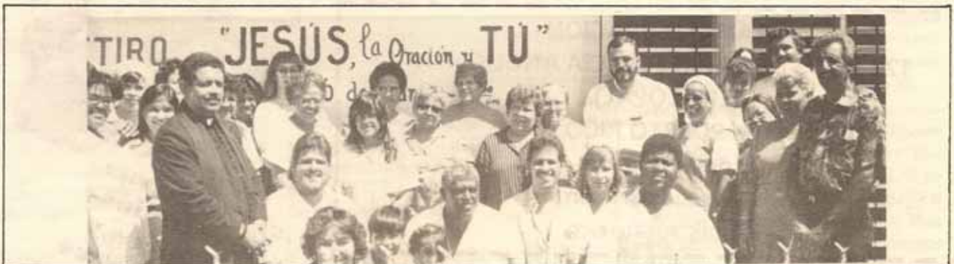
La Iglesia El Adviento en Carolina, celebró un exitoso retiro cuaresmal al cual asistieron fieles de varias iglesias del área. Sobre estas líneas la foto capta parte del grupo participante.