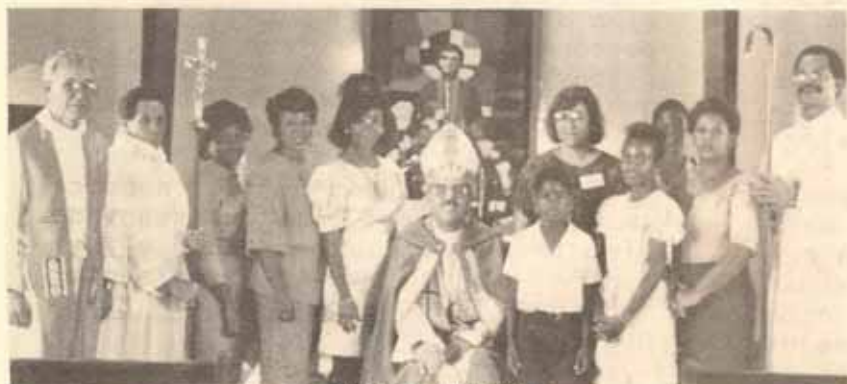
VISITA PASTORAL IGLESIA SANTO TOMÁS APÓSTOL