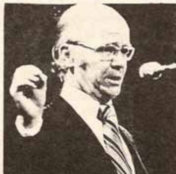
Rvdo. Dr. Martin E. Marty

Tres líderes religiosos mundiales se dieron cita en Milwaukee el pasado 5 de marzo y mantuvieron a una concurrencia de más de 2,800 personas en absoluta atención por más de dos horas mientras disertaban sobre el tema "¿Hacia Dónde llama el Único Dios a su Dividido Pueblo?"