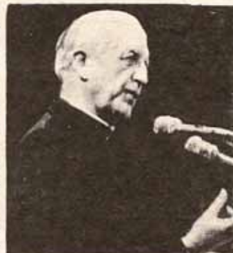
Cardenal Leon-Joseph Suenens

El Cardenal Suenens, quien fuera una de las figuras claves en la realización del Concilio Vaticano II, casi literalmente levantó a la concurrencia de sus asientos al proclamar que él anticipaba "no el Concilio Vaticano III, sino el Segundo Concilio de Jerusalén" el cual implicaría la participación de toda la Iglesia. Esta declaración fue bienvenida por todos los participantes. Declaró, además, que "nueve siglos de separación entre la Iglesia Católica Romana y las Iglesias Ortodoxas, y otros cuatro siglos de separación entre los Católicos Romanos y los Anglicanos, apuntan hacia una nueva primavera a través de un renovado interés en la liturgia, la vida de oración, la reconciliación y la misión de la Iglesia".