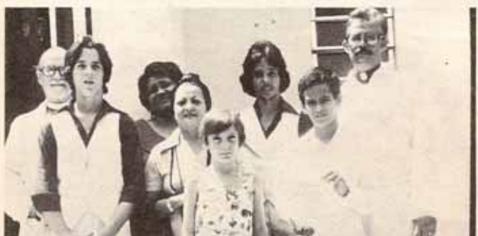
Confirmados y Recibidos en Visita Pastoral a la Iglesia La Sagrada Familia.