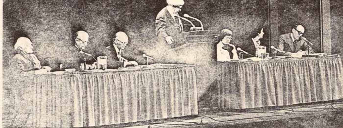
En la mesa a la izquierda aparecen de izquierda a derecha: Su eminencia A. Michael Ramsey, 100mo. Arzobispo de Cantorbery, el Cardenal Suenens y el Dr. Martin E. Marty.