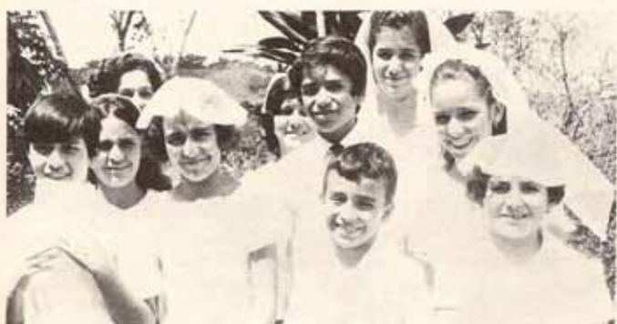
Confirmados y Recibidos en Visita Pastoral a las iglesias San Bartolomé y Santa Cruz en Lares.