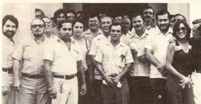
Asistentes a la Asamblea del Area Centro-Oeste.