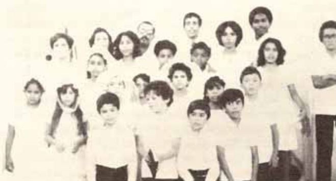
Confirmados y Recibidos en Visita Pastoral a la Iglesia Santísima Trinidad en Ponce.