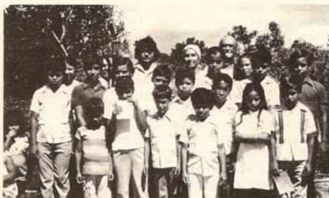
Confirmados y Recibidos en Visita Pastoral a la Iglesia La Transfiguración en el Bo. Rubias de Yauco.