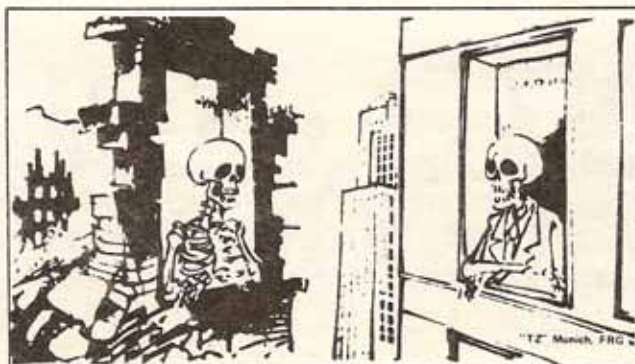
¿Cuál le parece más humana? ¿La bomba atómica clásica o la de neutrones?

La opinión pública mundial ha calificado semejante aseveración como un cinismo sin precedente, contrario a toda lógica y sentido humanitario. El «Times» londinense, el diario más