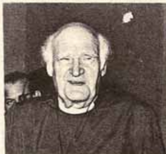
Rvdo. Martin E. Marty

El Revdo. Dr. Martin E. Marty enfatizó en su presentación el hecho de que la Iglesia es algo ya hecho sino que está en un continuo hacerse. Declaró, además, que "las más dolorosas divisiones entre los cristianos no son de índole teológica sino políticas, económicas, racistas y sexistas. Estas son las que destruyen a nuestros pueblos y familiares. Las divisiones históricas no son nuestra mayor preocupación, añadió. Debemos aprender a ver a Cristo en nuestros hermanos y aprender que nuestras vidas están esplendorosamente cimentadas alrededor de la cruz, por lo cual, en vez de exagerar nuestras diferencias, debemos aprender a valorizar la diversidad y la variedad de dones que ello trae."