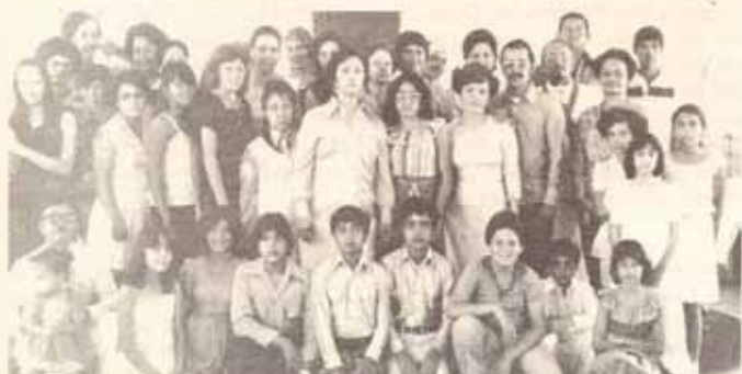
Confirmados y Recibidos en Visita Pastoral a la Iglesia San Pablo en Arecibo.