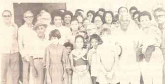
Visita Pastoral en la Iglesia Sta. Cecilia en Ensenada.