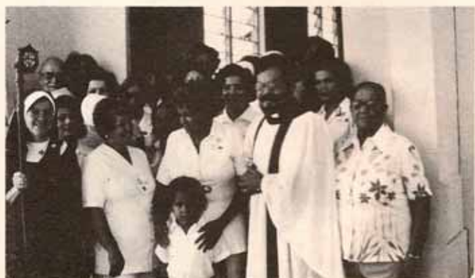
Parte de la feligresía de la Capilla San Lucas en Ponce con motivo de Visita Pastoral del Obispo.