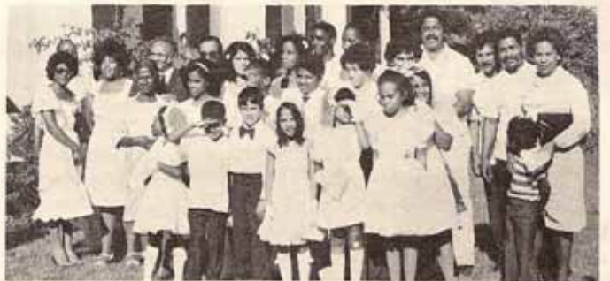
Parte del grupo de Confirmación y Recepción