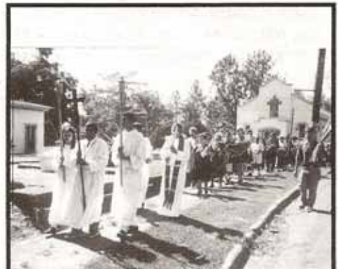
Procesión de Domingo de Ramos Por Feligreses de la Parroquia La Sagrada Familia Bo. Saint Just en Trujillo Alto 23 de marzo de 1997

La revisión litúrgica del Libro de Oración Común de 1989, formulario de liturgia y oración en toda la Comunión Anglicana, iniciada conjuntamente con la reforma litúrgica del Concilio Vaticano II, expresa la fe y doctrina de la iglesia. La ordenación de mujeres a su vez, de ninguna manera niega la doctrina Católica y Apostólica de la Iglesia, sino que es un asunto de tradición y disciplina.