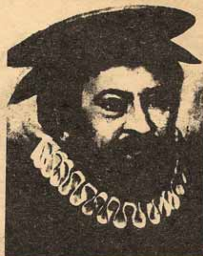
CASIODORO DE REINA, primer traductor de la Biblia completa al español. Nació en Sevilla, España, en 1520, murió en Frankfort, Alemania, en 1594. La primera edición de la Biblia de Reina se publicó en Basilea, Suiza, en 1569.