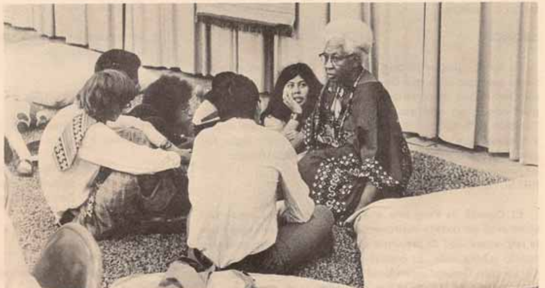
Unos pocos pero...con gran interés, discutiendo parte de la problemática común.