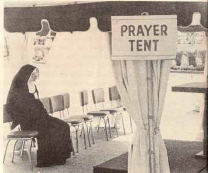
La Capilla de Oración continuada para el feliz ex