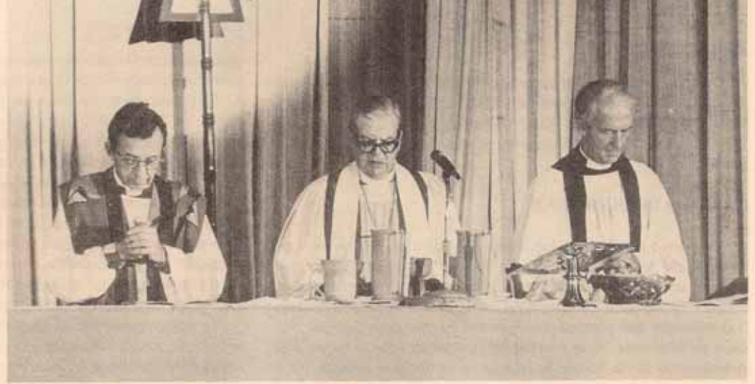
Momento de la Consagración de los elementos en la Sta. Comunión inaugural.