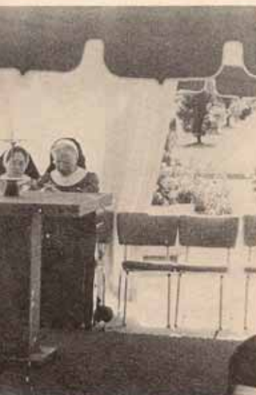
...o y resultado de la Convención.