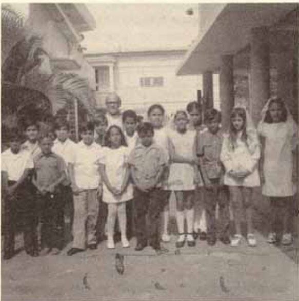
Confirmación en Santa María Virgen, Ponce, el 2 de septiembre de 1973.