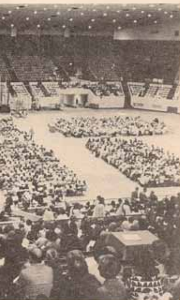
...e oficio inaugural. Vista general.