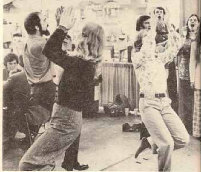
No todas las sesiones de trabajo...Las juventudes se encargaron de d