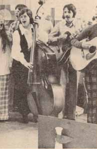
...eran discusiones acaloradas y ...unas notas de alegría y colorido.