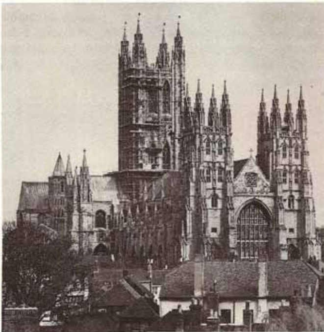
Vista de la Catedral de Canterbury.