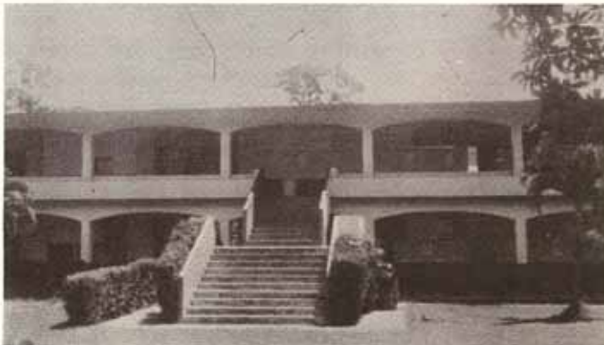
Fachada de San Justo