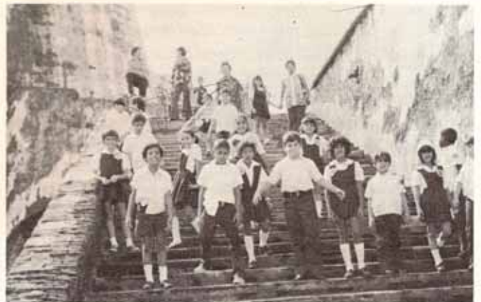
Una actividad extramural

Este aumento en matrícula se debe a la necesidad de este tipo de escuela en la comunidad que se mencionó anteriormente y más aún, a que son los propios padres de los niños quienes están agradecidos de la buena enseñanza que se