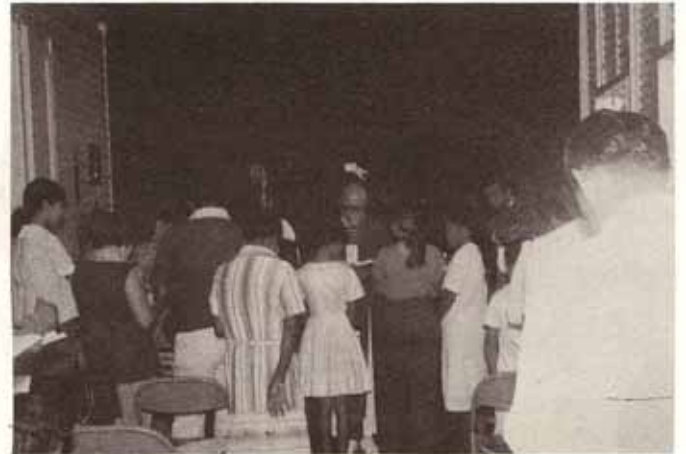
Vista de una confirmación en la Iglesia San Miguel .