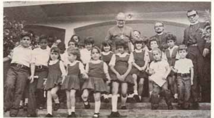
Parte del estudiantado

Para la comunidad de Saint Just y áreas adyacentes San Justo ha venido a satisfacer una necesidad; pues una escuela de la categoría de ella era de importancia en esta parte del