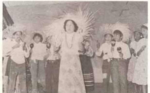
Nuestros futuros artistas