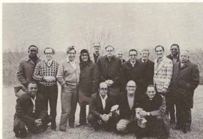
Obispos de ultramar que asistieron a la consulta.

Nosotros la Junta Editora de CREDO felicitamos a las cabezas de nuestras iglesias que participaron en los postulados aquí esbozados a la vez que nos hacemos solidarios de estos principios.