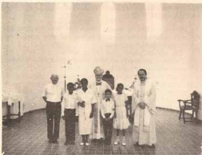
Visita pastoral Iglesia Santísima Trinidad Ponce, P.R.