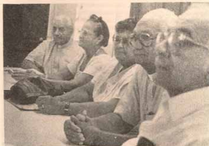
Columnas en granito que sostienen a la Iglesia.