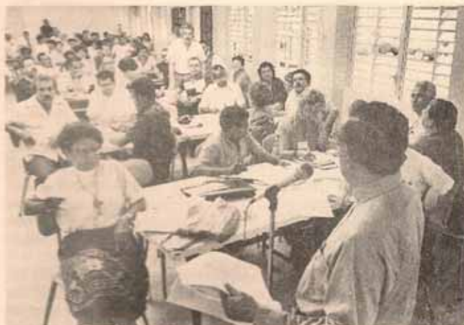
Vista parcial de la Asamblea Diocesana.