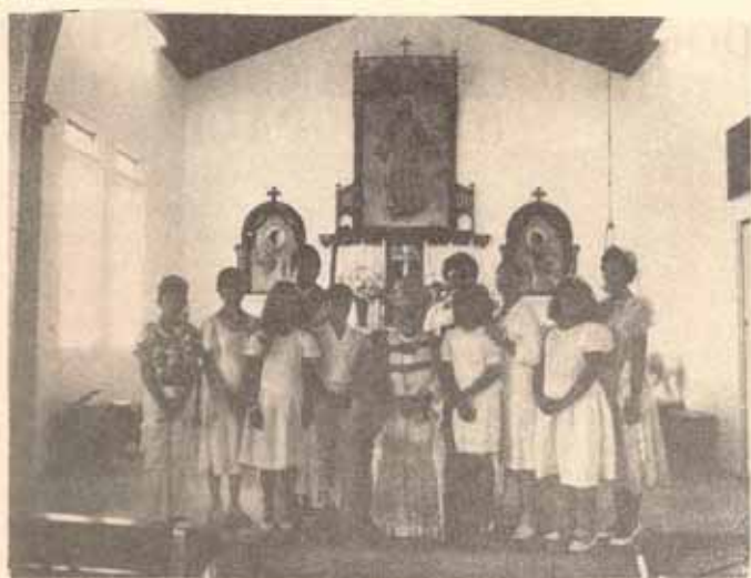
Visita pastoral Iglesia Santa María Virgen Bo. Clausells, Ponce, P.R.