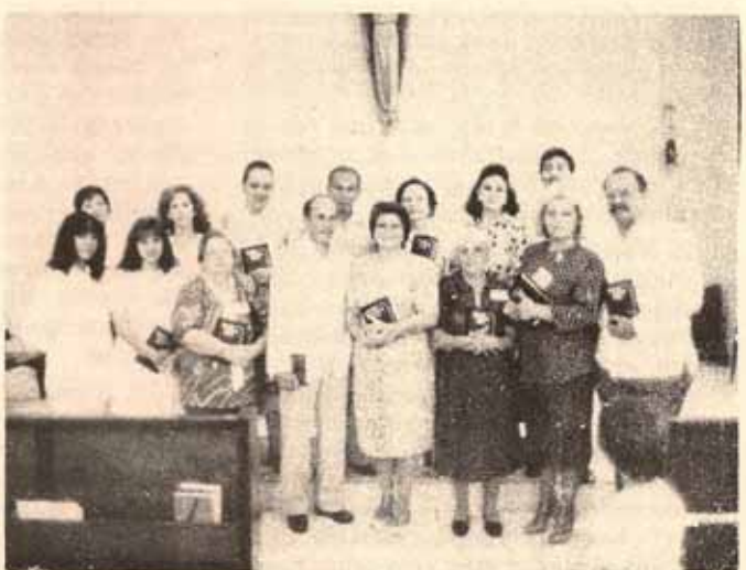
Visita pastoral Iglesia La Encarnación Ha...