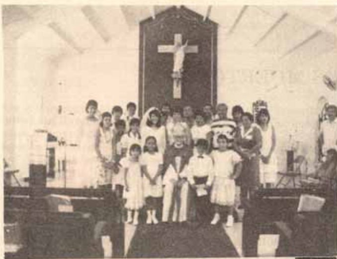
Visita pastoral Iglesia La Resurrección Manatí, P.R.