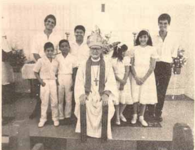
Visita pastoral Iglesias San Bartolomé y Santa Cruz Bo. Castañer, Adjuntas, P.R.