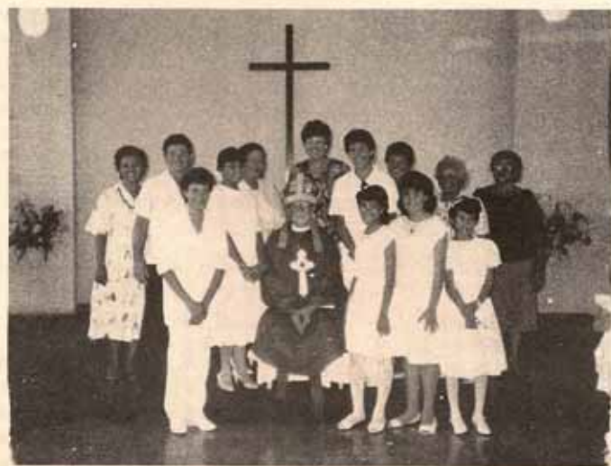
Visita pastoral Iglesia Buen Pastor Fajardo, P.R.